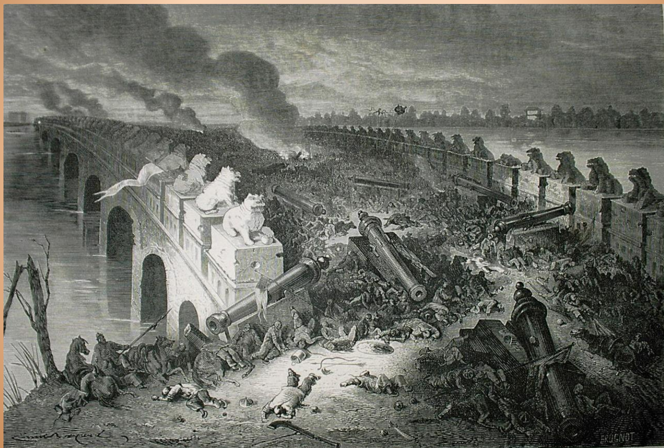
Le pont de Pa-li-Kiao, le soir de la bataille. — Dessin de E. Bayard d'après une esquisse de M. E. Vaumort (album de Mme de Bourboulon).