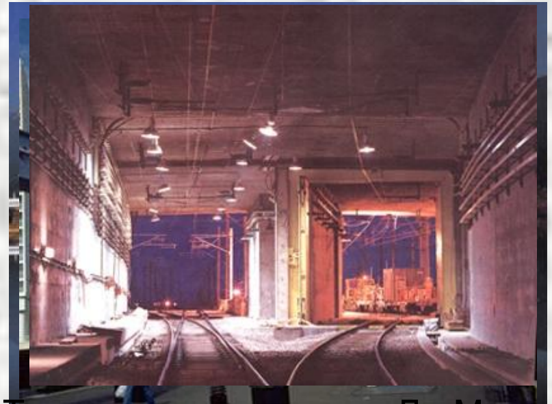
Туннель под проливом Ла-Манш "Синкансен". Япония