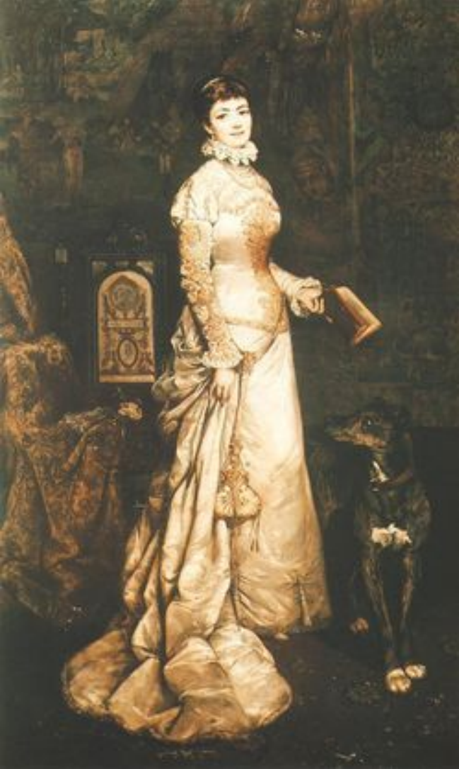
Portret Heleny Modrzejewskiej autorstwa Tadeusza Ajdukiewicza z 1880