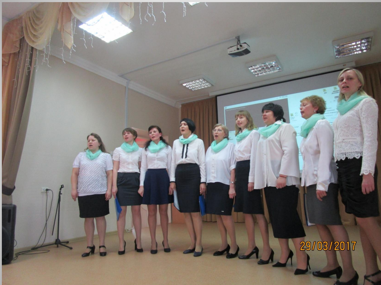
Вокальный коллектив Д/с №370