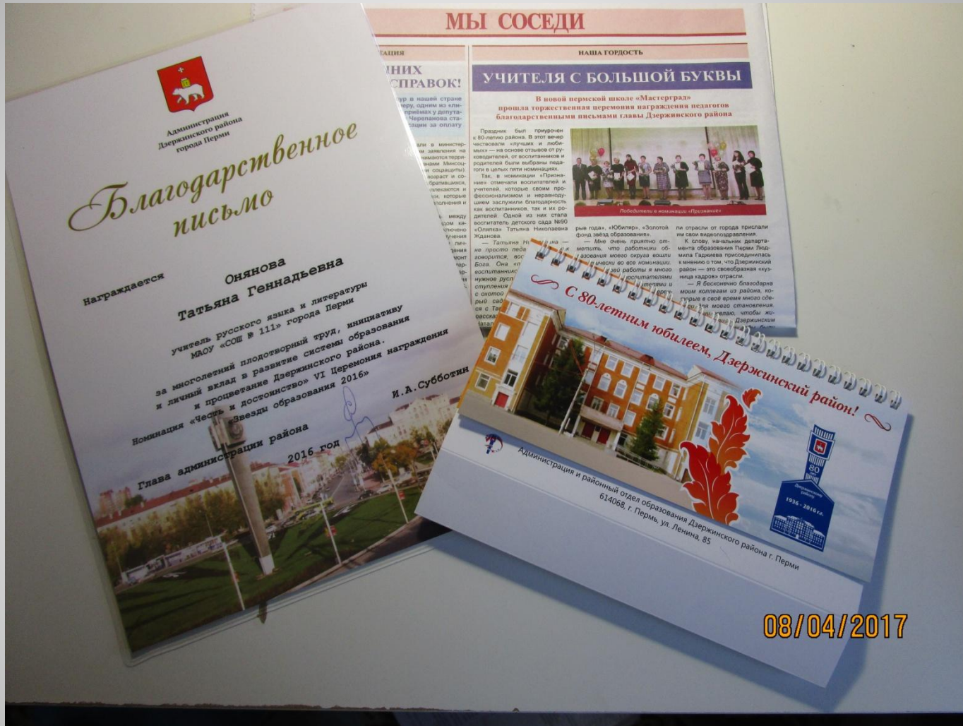
Календарь к 80-летию юбилею района