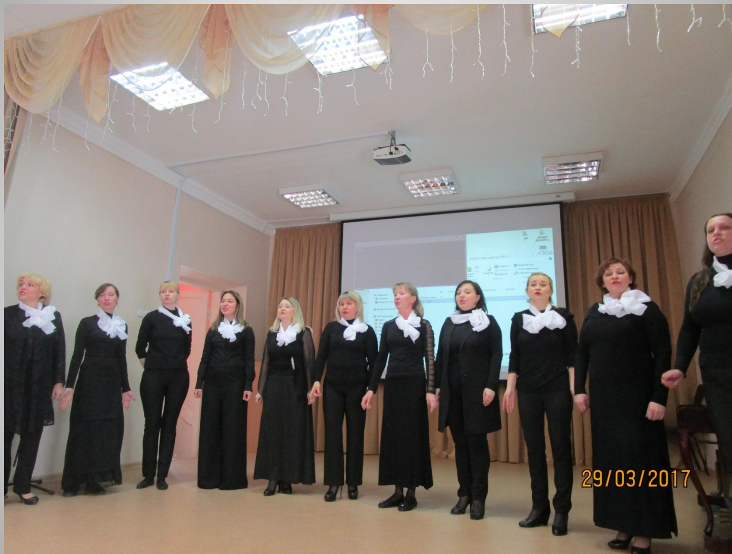
Вокальный коллектив Д/с №203