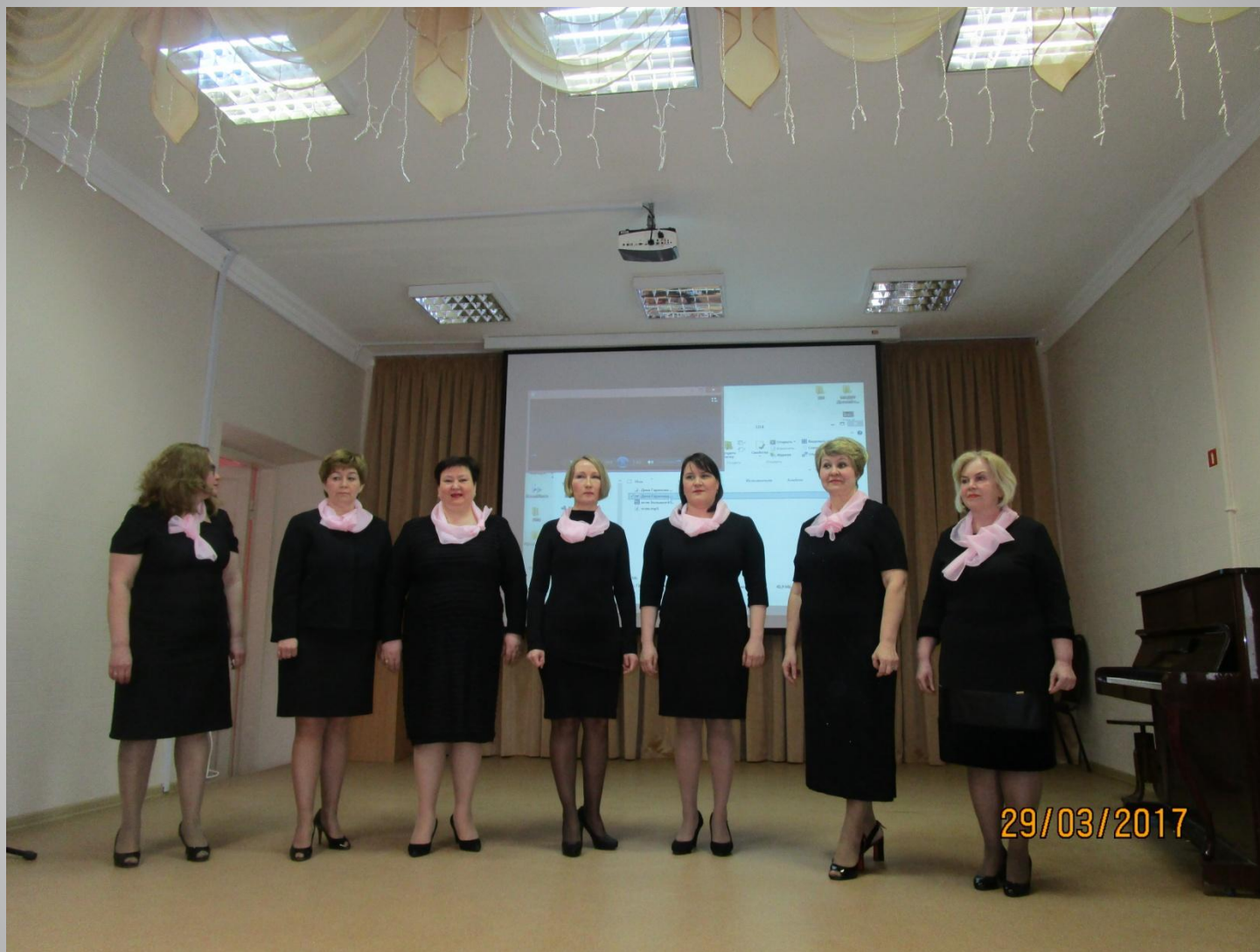
Вокальный коллектив Д/с №384