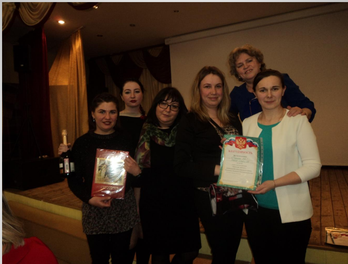
IX районный чемпионат интеллектуальных игр