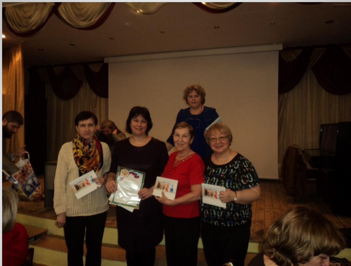
IX районный чемпионат интеллектуальных игр