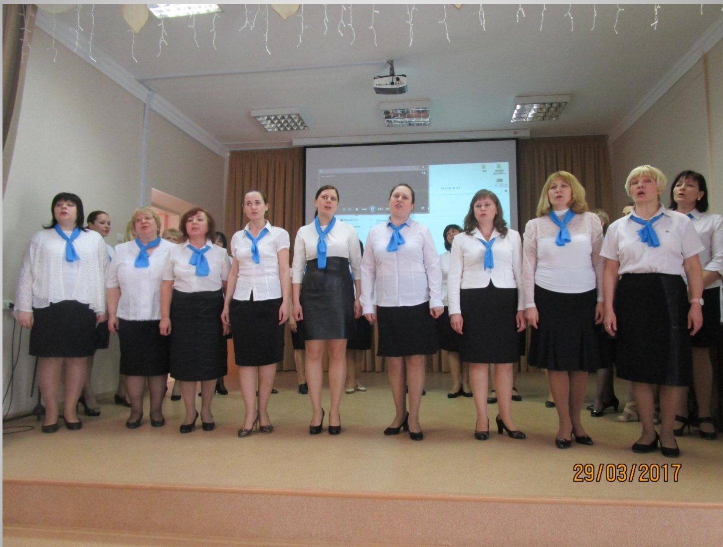
Хоровой коллектив Д/с №120