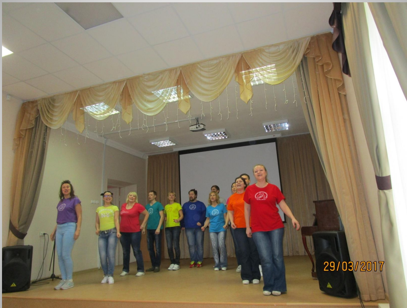
Вокальный ансамбль ЦДТ «Юность»