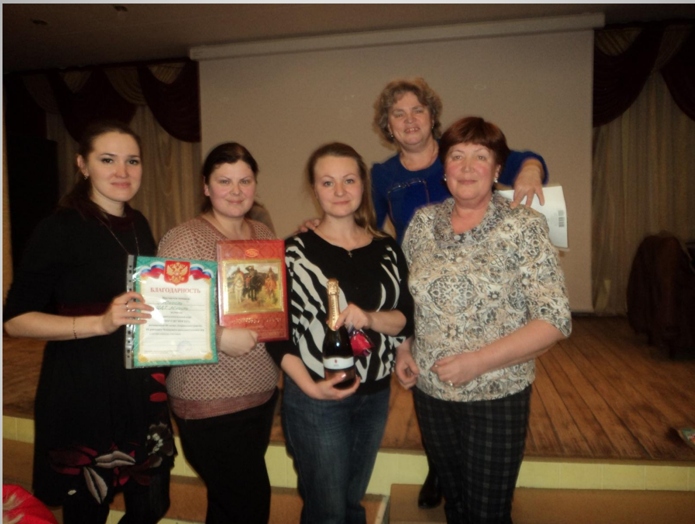
IX районный чемпионат интеллектуальных игр