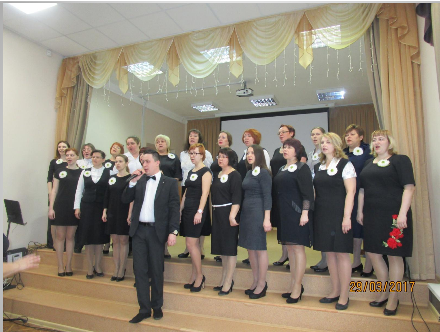
Проект «Поют педагоги Перми», ХОР СОШ №59