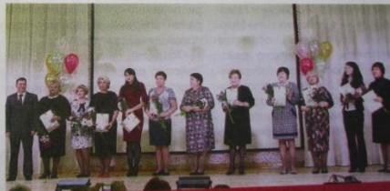
Победители в номинации «Признание»

...рав года, «Юбиляр», «Золотой фонд звёзд образования». Мне очень приятно отметить, что работники об-