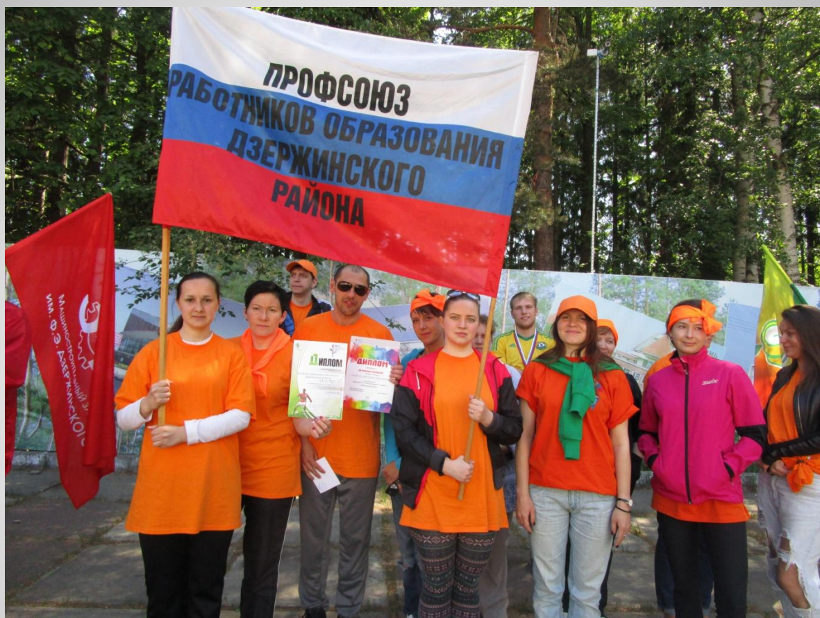
Традиционный районный турслет