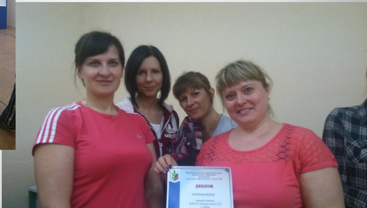
Дружная команда д/с №203