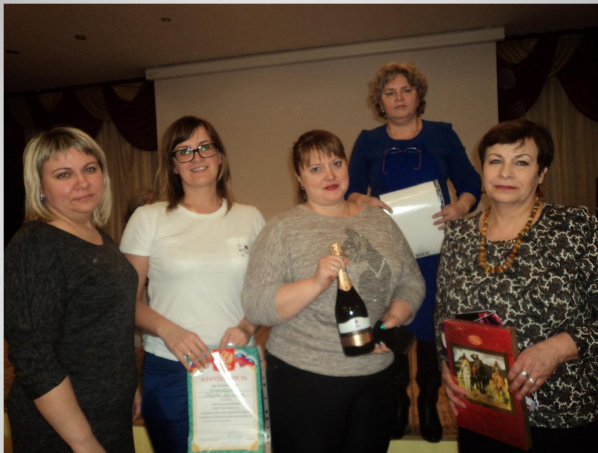
IX районный чемпионат интеллектуальных игр