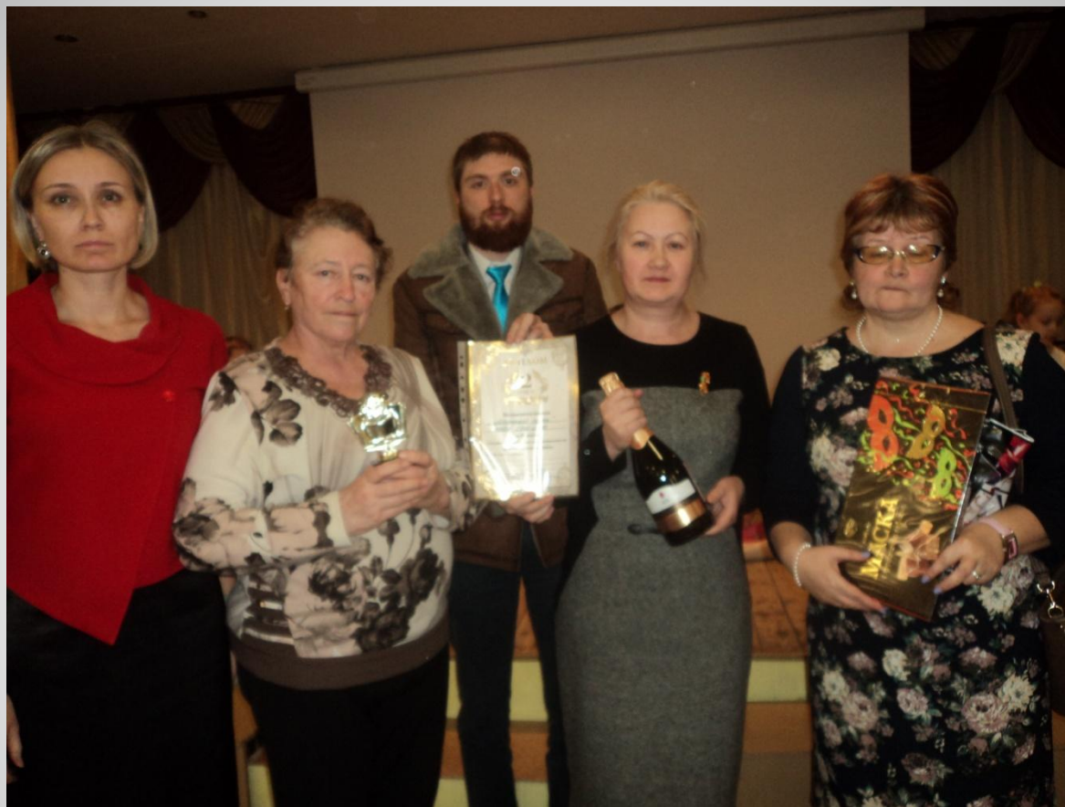
IX районный чемпионат интеллектуальных игр