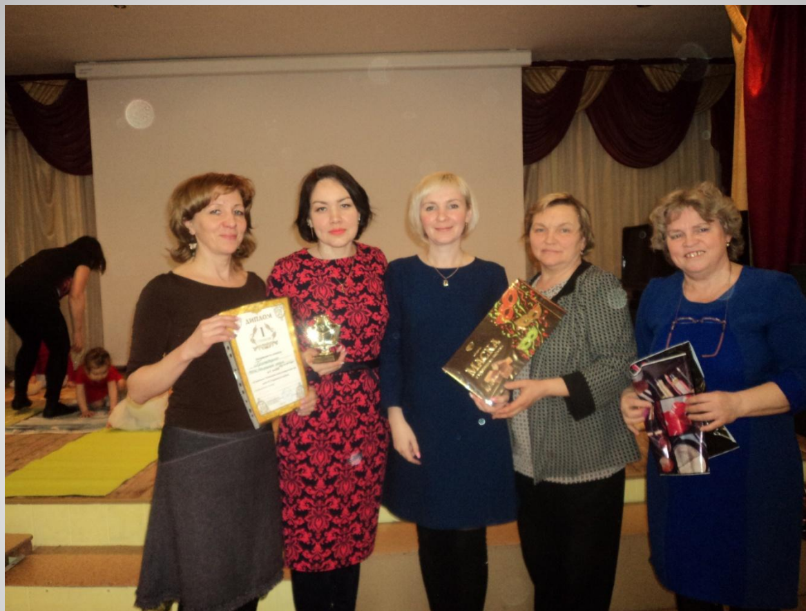
IX районный чемпионат интеллектуальных игр