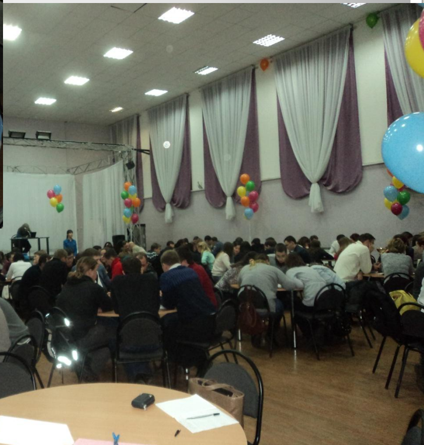
Городской молодежный чемпионат интеллектуальных игр