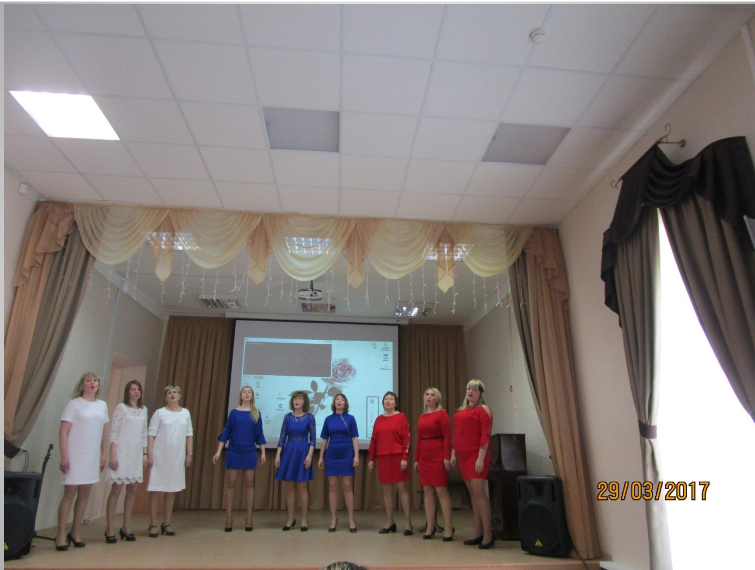
Вокальный коллектив Д/с №103