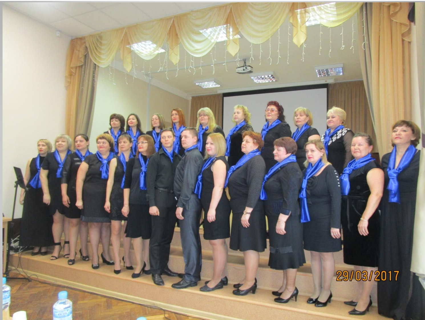
Хоровой коллектив СОШ №111