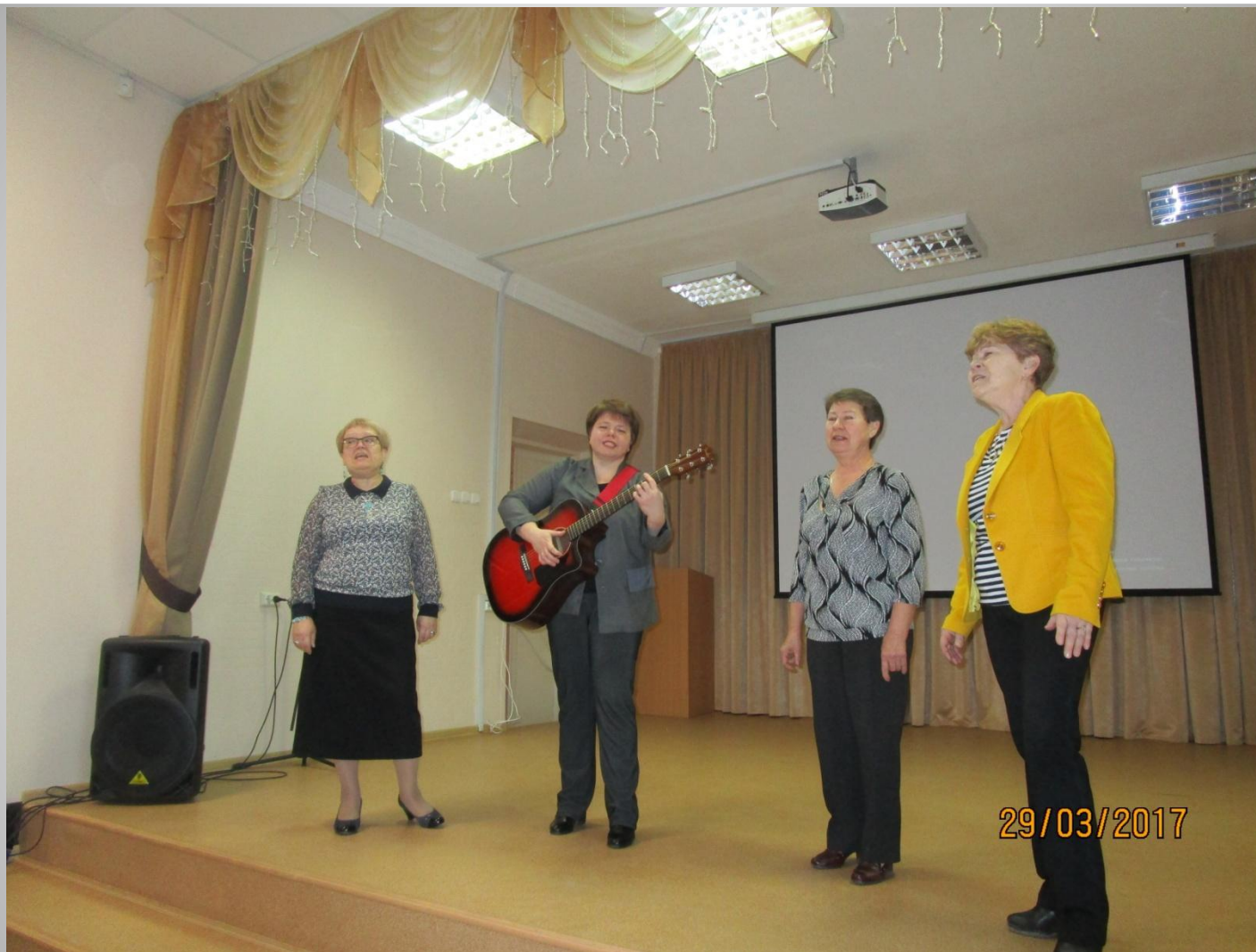
Вокальный ансамбль «Лира» НШ «Мультипарк»