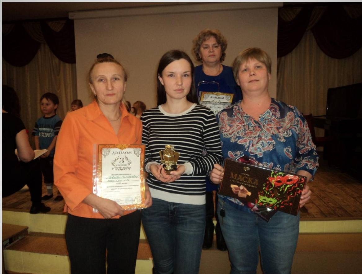
IX районный чемпионат интеллектуальных игр