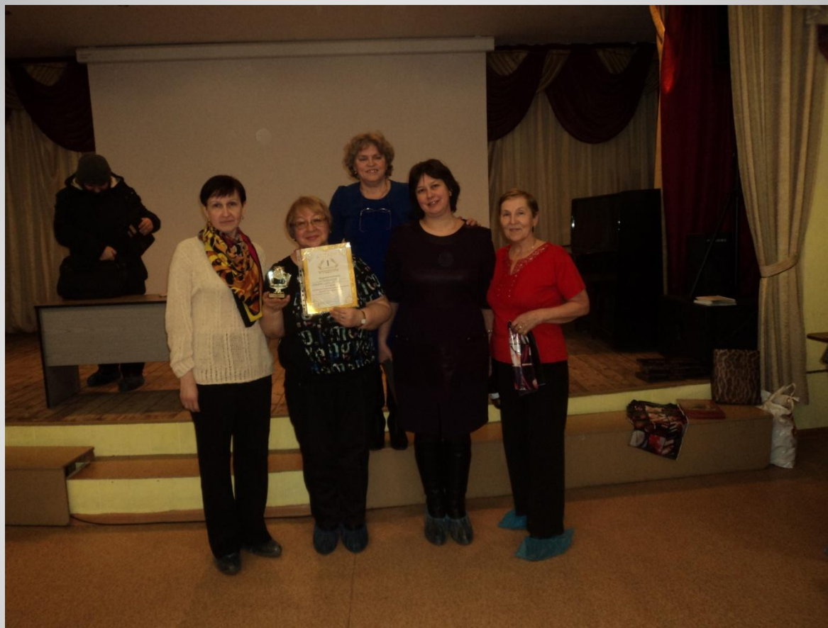
IX районный чемпионат интеллектуальных игр