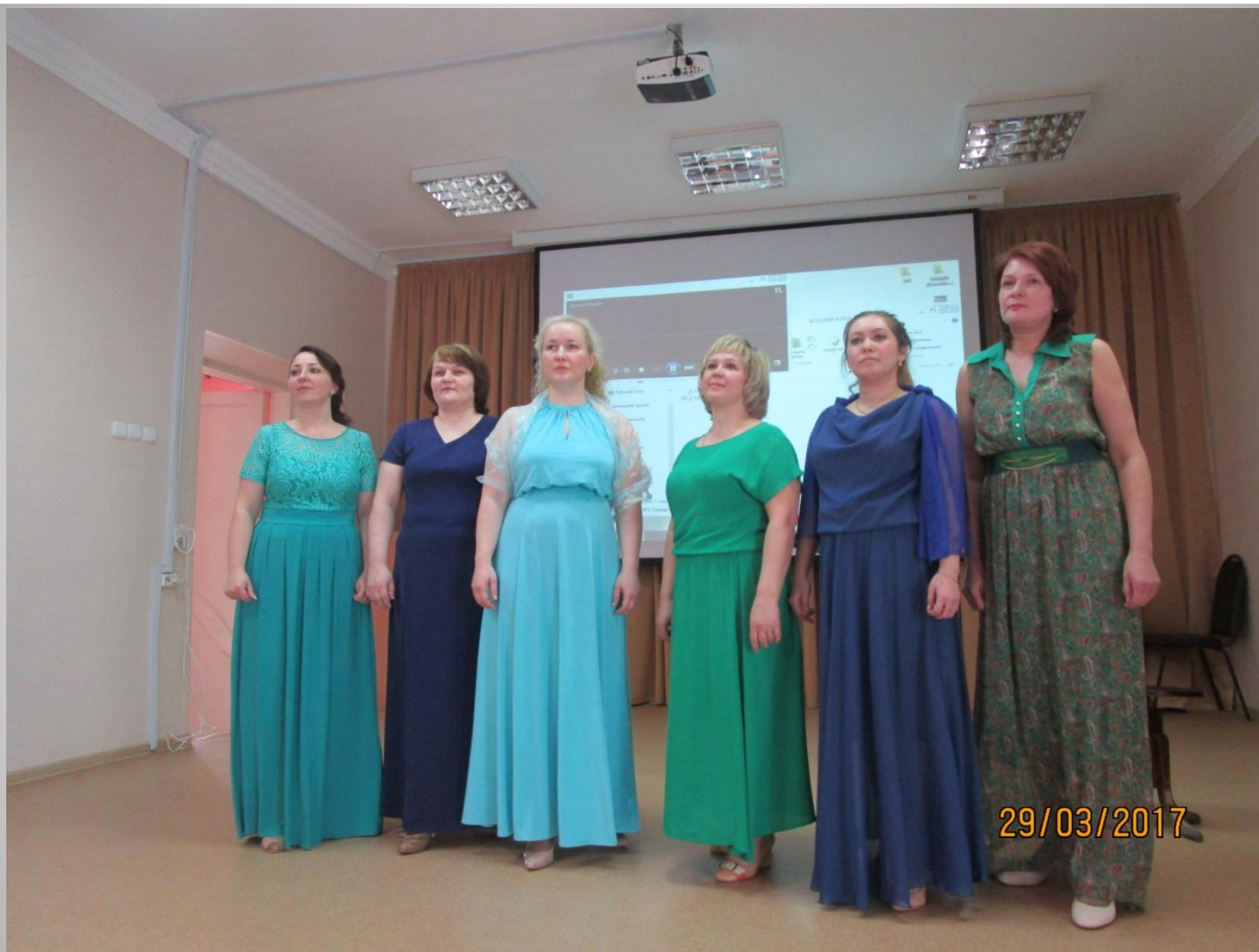
Вокальный коллектив д/с «Совушка» г. 31