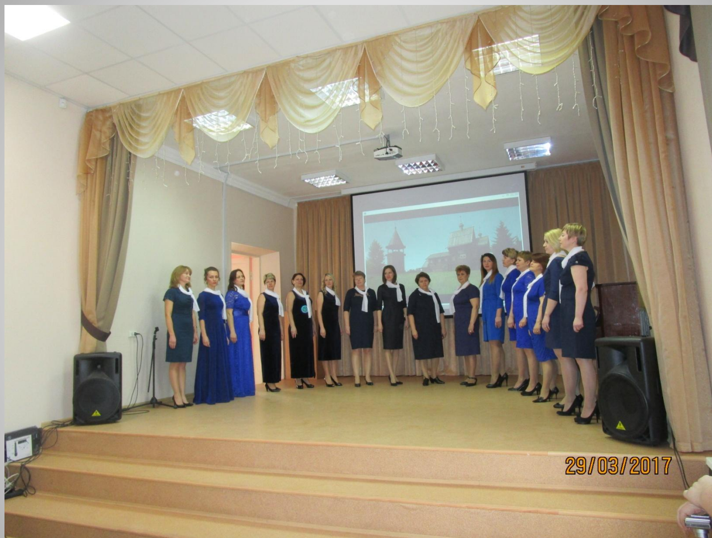
Хоровой коллектив Д/с №407