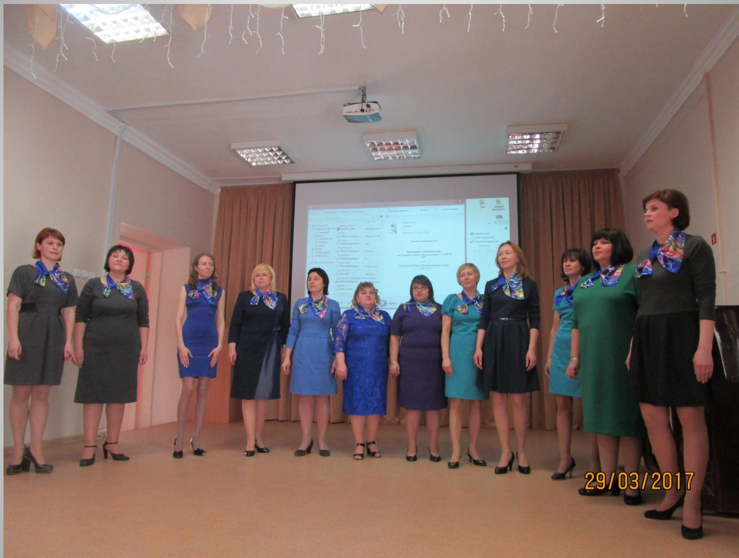
Вокальный коллектив д/с №360