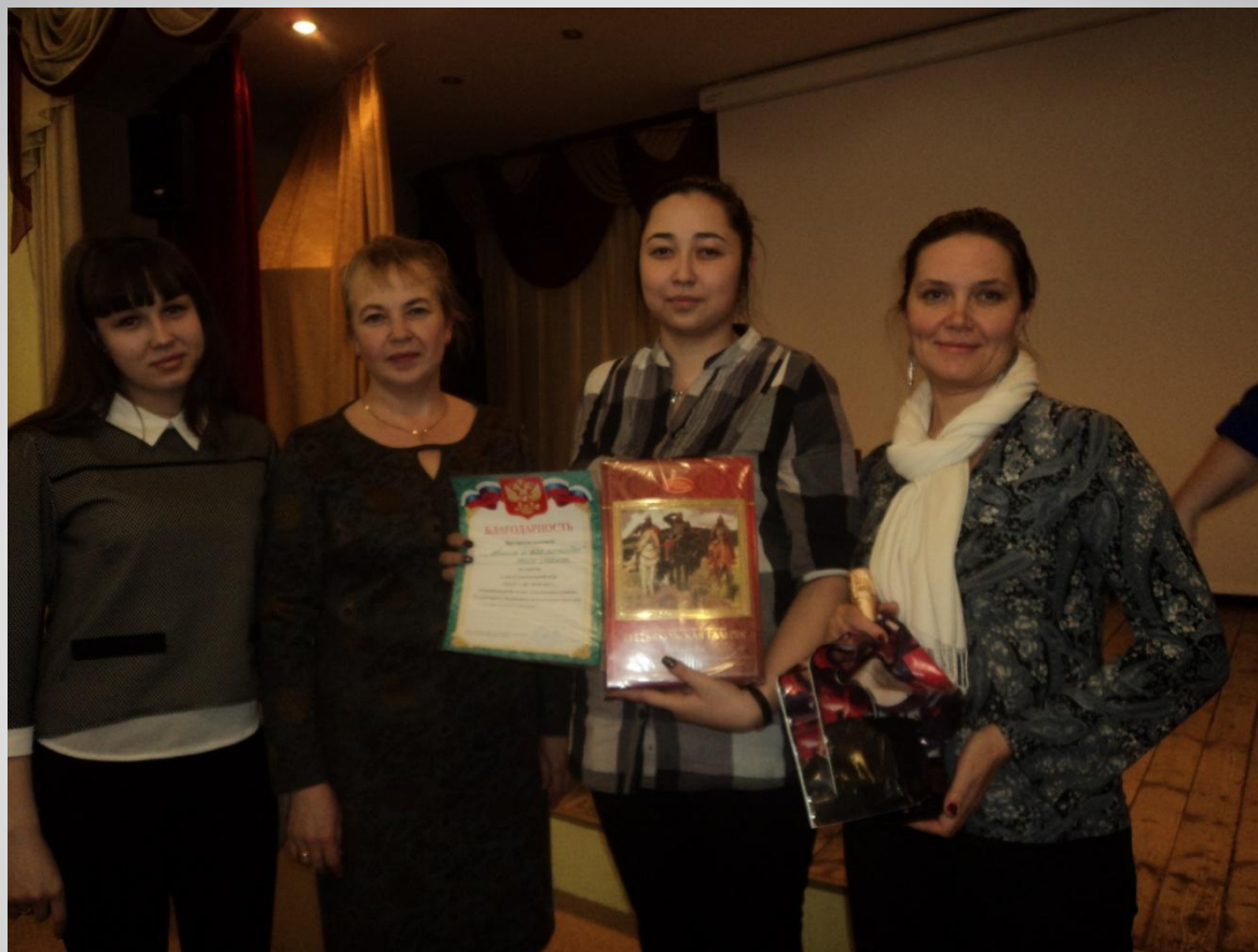
IX районный чемпионат интеллектуальных игр