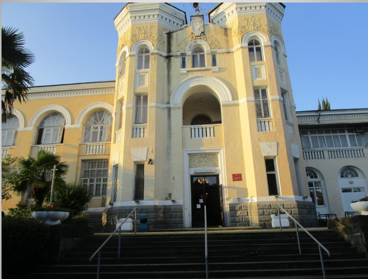
Санаторий «Кудепста» (г.Сочи)