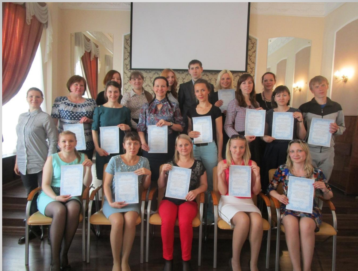
Совет молодых педагогов района