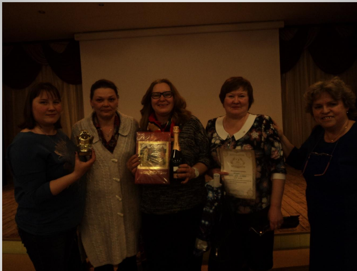
IX районный чемпионат интеллектуальных игр