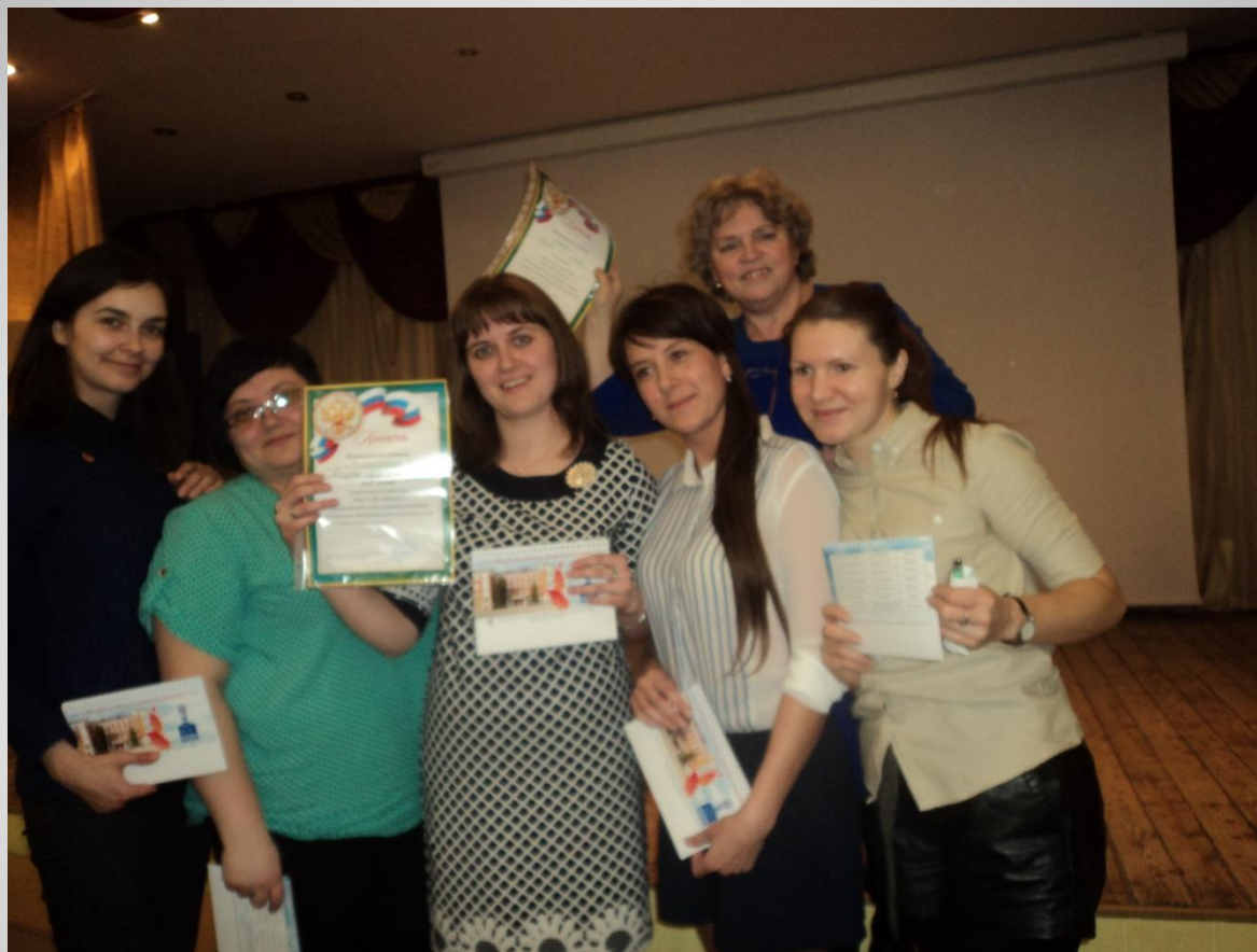
IX районный чемпионат интеллектуальных игр