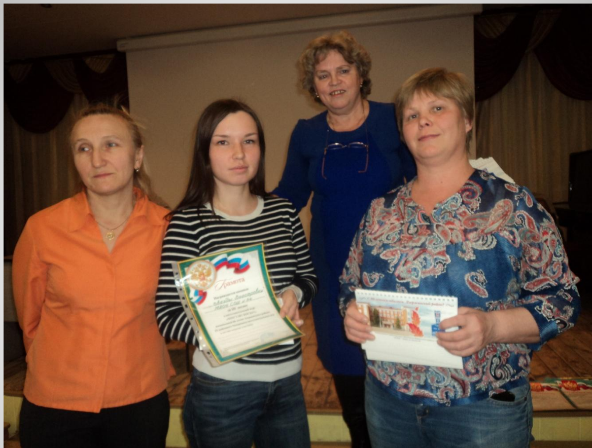
IX районный чемпионат интеллектуальных игр