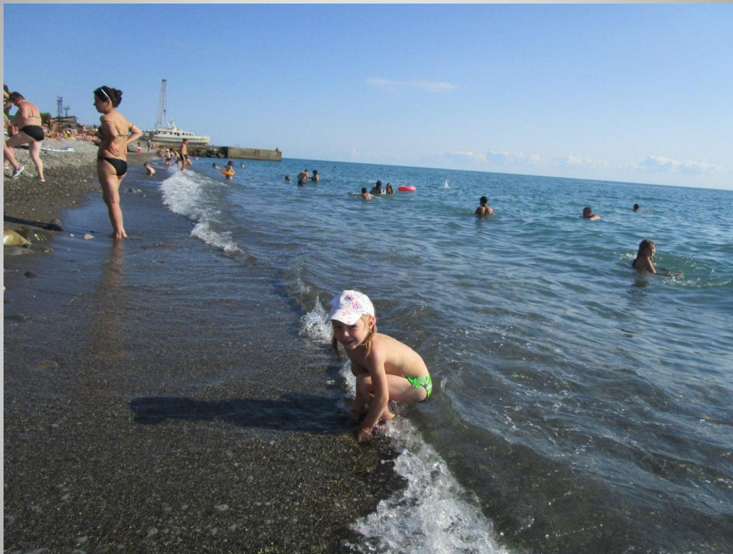
На берегу Черного моря