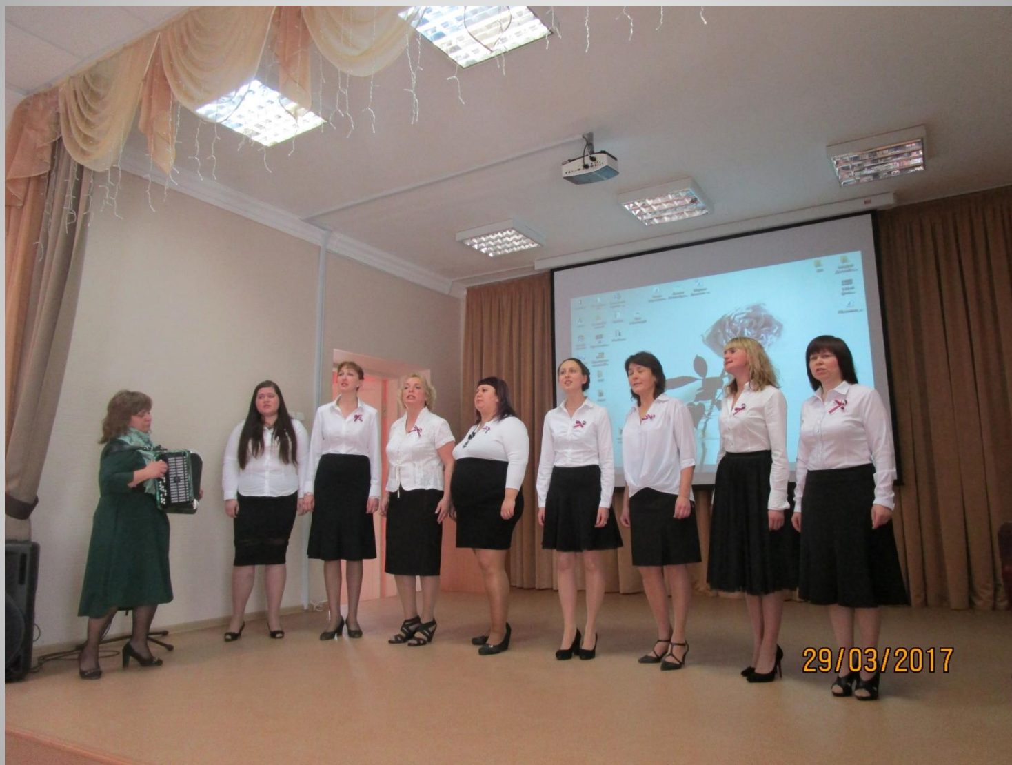
Вокальный коллектив д/с №268