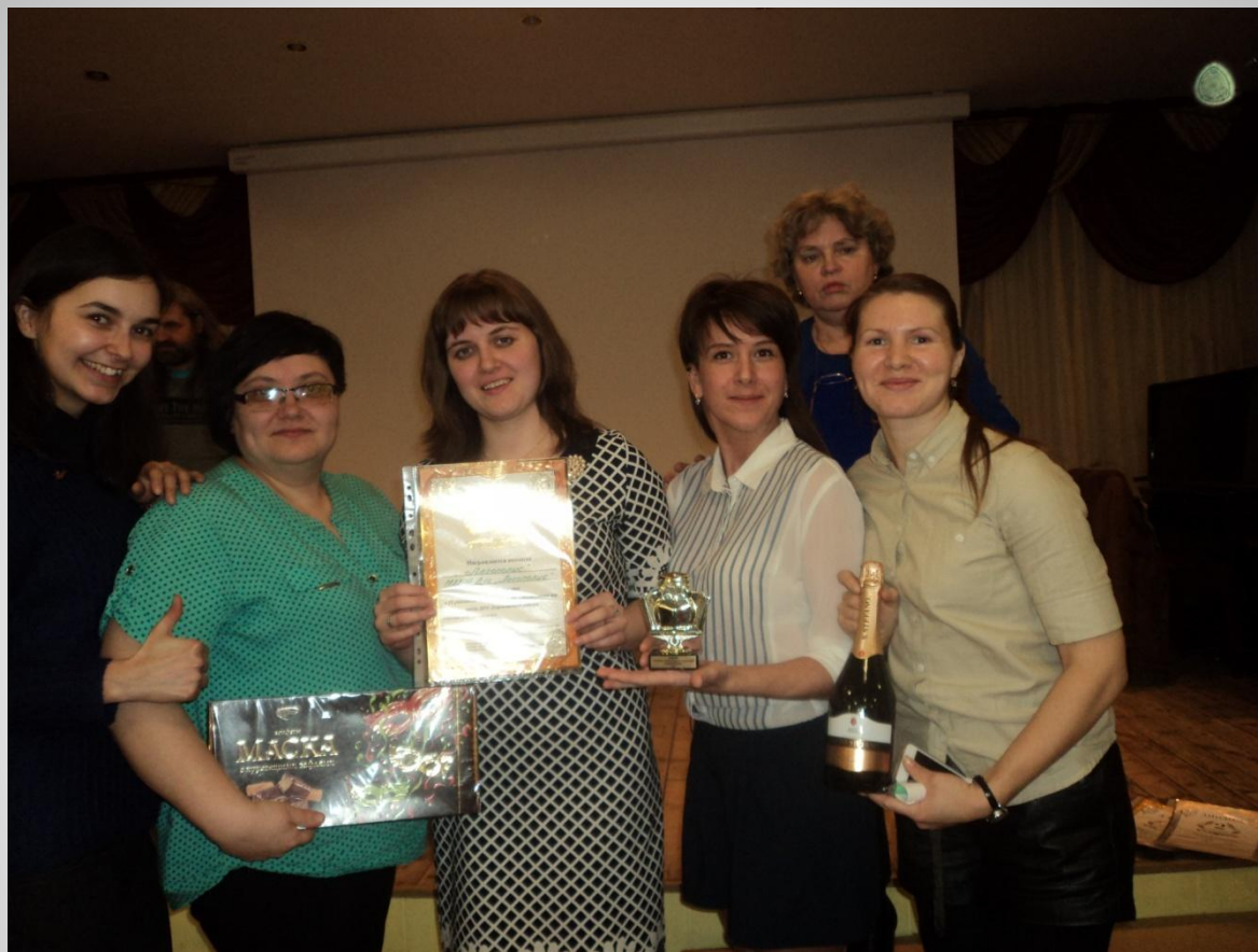
IX районный чемпионат интеллектуальных игр