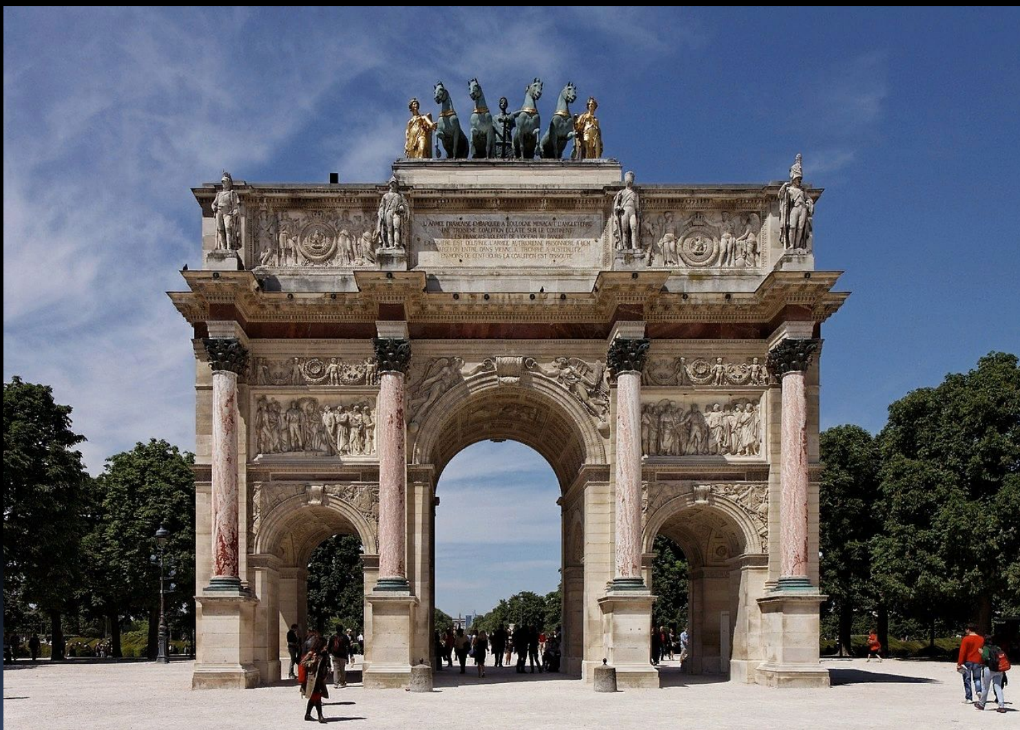
Триумфальная арка на площади Каррузель