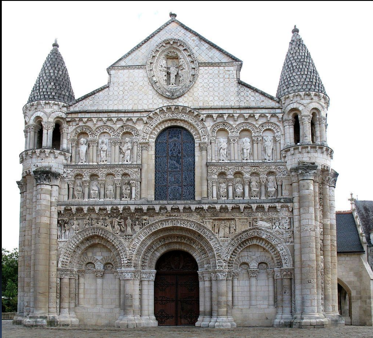
Notre-Dame-La Grande, Poitiers, France