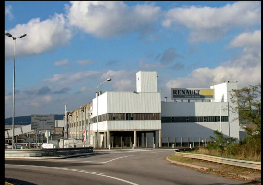
Завод «Renault» в городке Обержанвиль

Ведётся добыча железной и урановых руд, бокситов. Ведущие отрасли обрабатывающей промышленности — машиностроение, в том числе автомобилестроение, электротехническое и электронное (телевизоры, стиральные машины и другое), авиационное, судостроение (танкеры, морские паромы) и станкостроение. Франция — один из крупнейших в мире производителей химической и нефтехимической продукции (в том числе каустической соды, синтетического каучука, пластмасс, минеральных удобрений, фармацевтических товаров и другого), чёрных и цветных (алюминий, свинец и цинк) металлов. Большой известностью на мировом рынке пользуются французская одежда, обувь, ювелирные изделия, парфюмерия и косметика, коньяки, сыры (производится около 400 сортов).