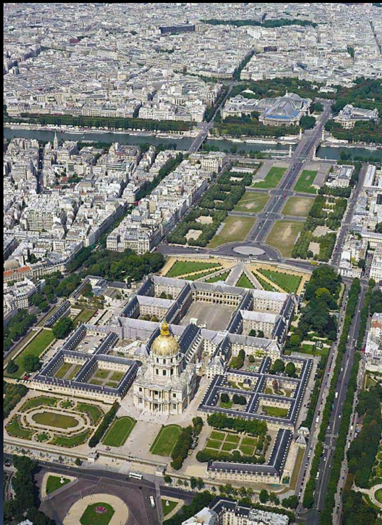
Вид на Дом инвалидов с высоты птичьего полёта