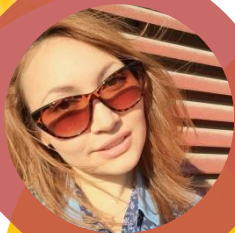
РУКОВОДИТЕЛЬ ОТБОРУ ВОЛ