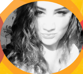
ЦКАЯ ВЛЕНИЯ ННЫХ