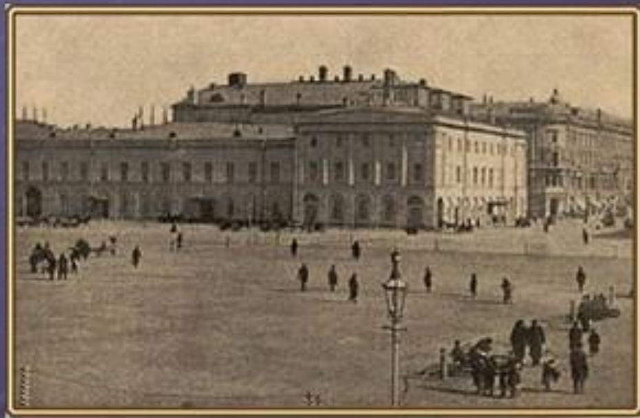
Здание Московского Малого театра, фотография 90-х годов XIX века