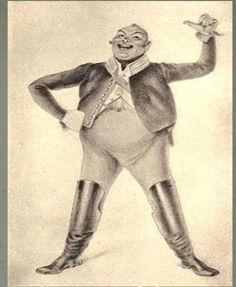
Городничий Антон Антонович Сквозник-Дмухановский.

Чиновники же, привыкшие судить по себе, всячески пытаются угодить лже-ревизору и подсовывают ему взятки, при этом, не забывая доносить, друг на друга. Хлестаков же человек жадный очень быстро увлекается возможностью легкой наживы, и с приличной суммой покидает город, оставляя бюрократов ни с чем. И тут выясняется, что это был вовсе не ревизор. Причем выясняется обычным для местных нравов способом: почтмейстер, по своему обыкновению, вскрыл письмо Хлестакова. После чтения письма, из которого чиновники узнали, что Хлестаков думает о них на самом деле, после поиска виновников всего случившегося произошло то, что и должно было произойти: приехал настоящий ревизор