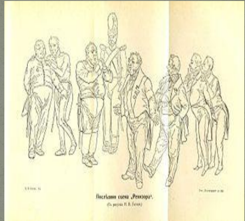
Собственноручный рисунок Гоголя к последней сцене Ревизора. 1836 год