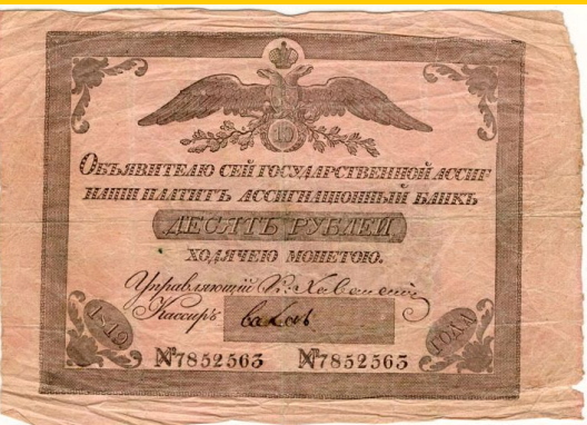
Ассигнация при Екатерине II