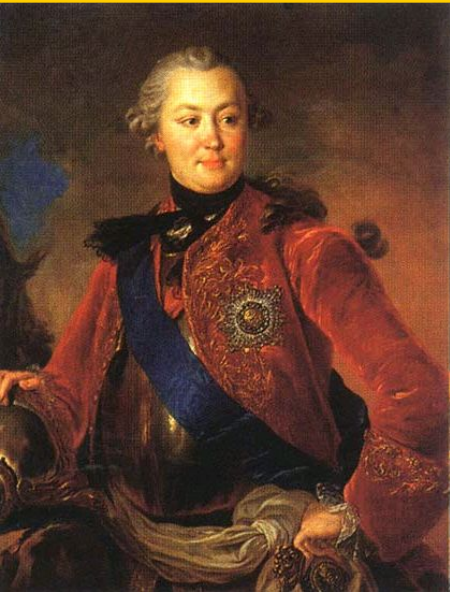
Ф. Рокотов. «Портрет графа Г.Г.Орлова».