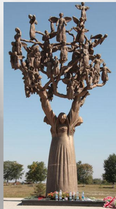
У входа на кладбище- памятник «Древо скорби»