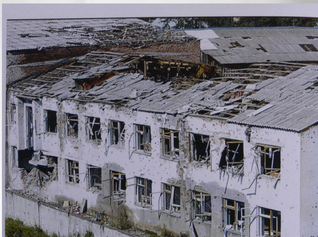
Разрушенное здание школы