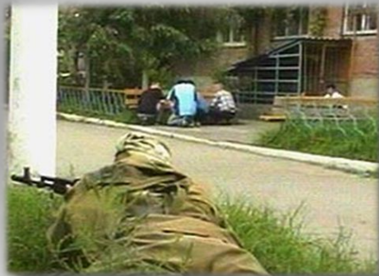
Освобождение заложников бойцами спецподразделений «Альфа» и «Вымпел»