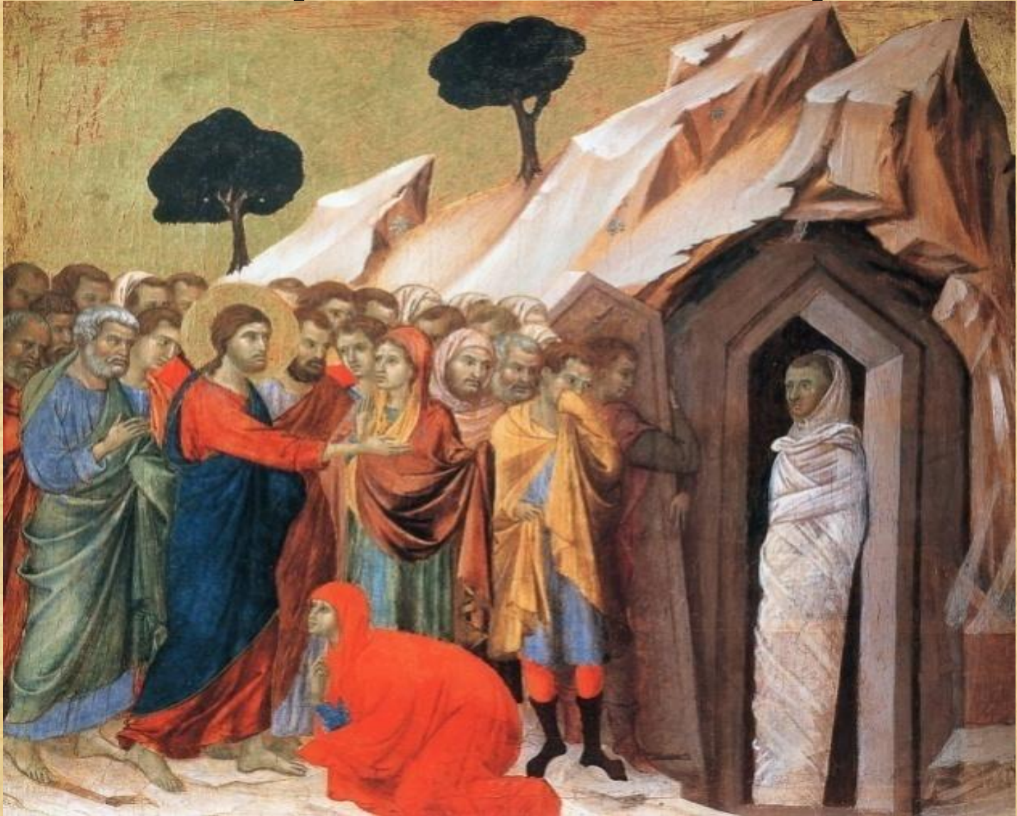
Икона «Воскрешение Лазаря»