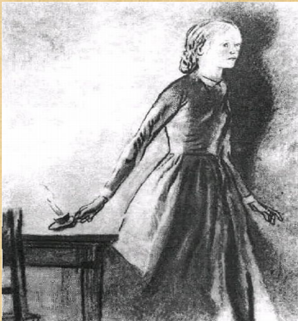
«Соня Мармеладова» Д.Шмаринов