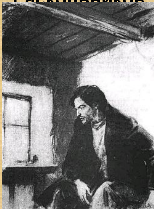
«Раскольников» Шмаринов Д. А.