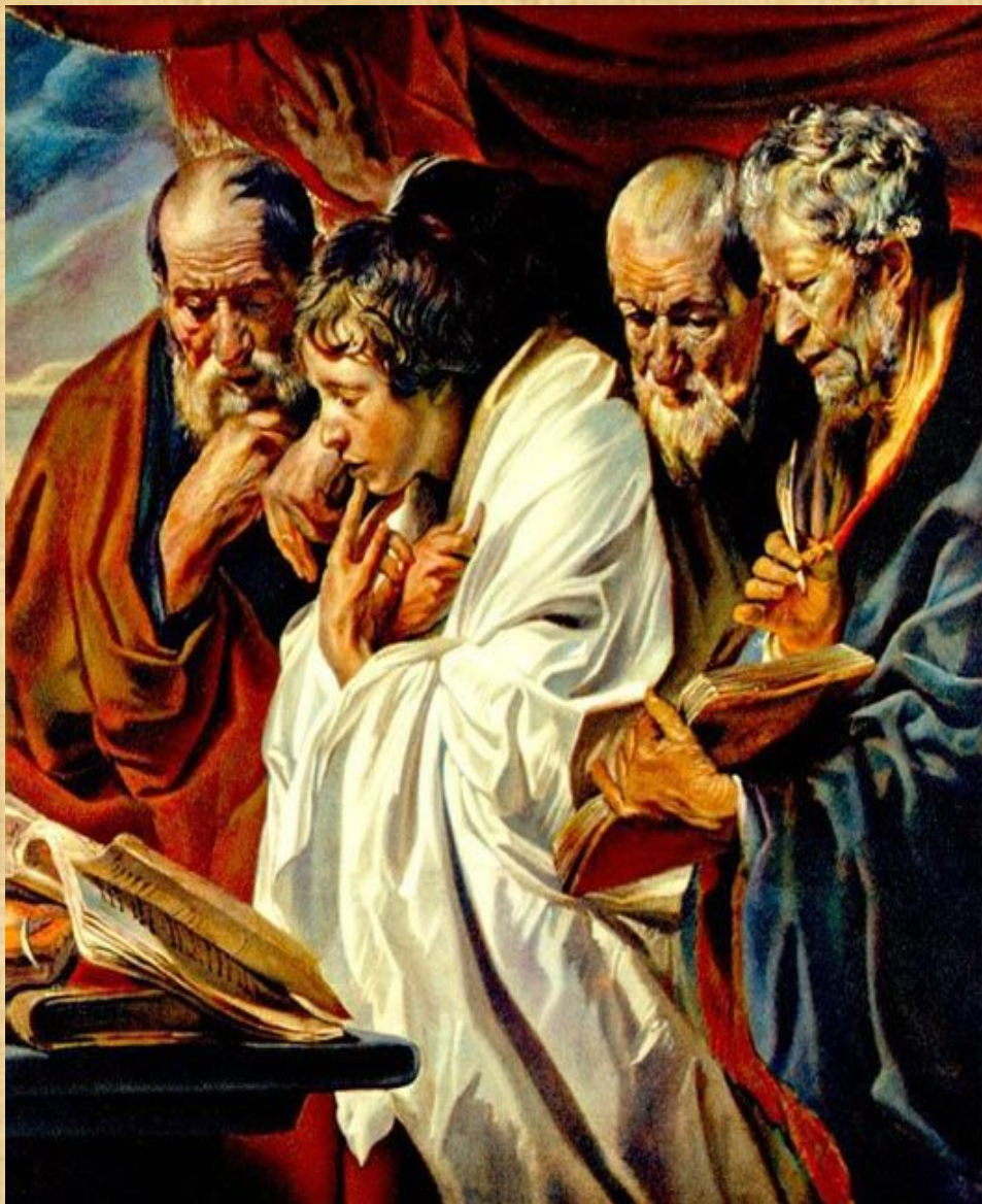
Йорданс «Четыре евангелиста»