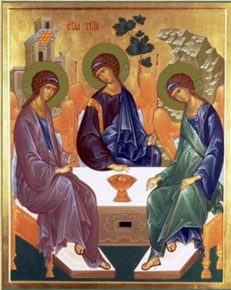
Рублев И. Икона «Святая Троица»