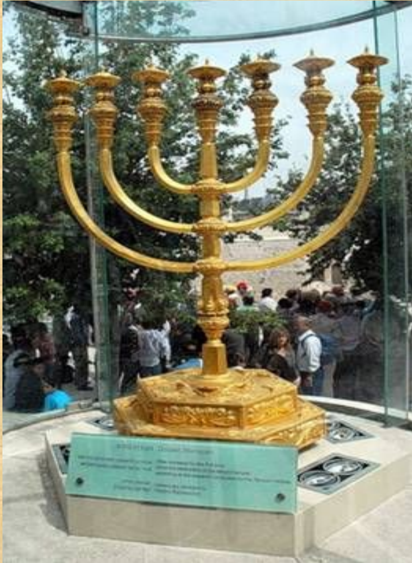
Золотой семисвечник в Иерусалиме