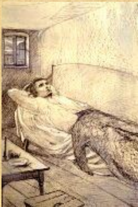
«Раскольников» И. Глазунов