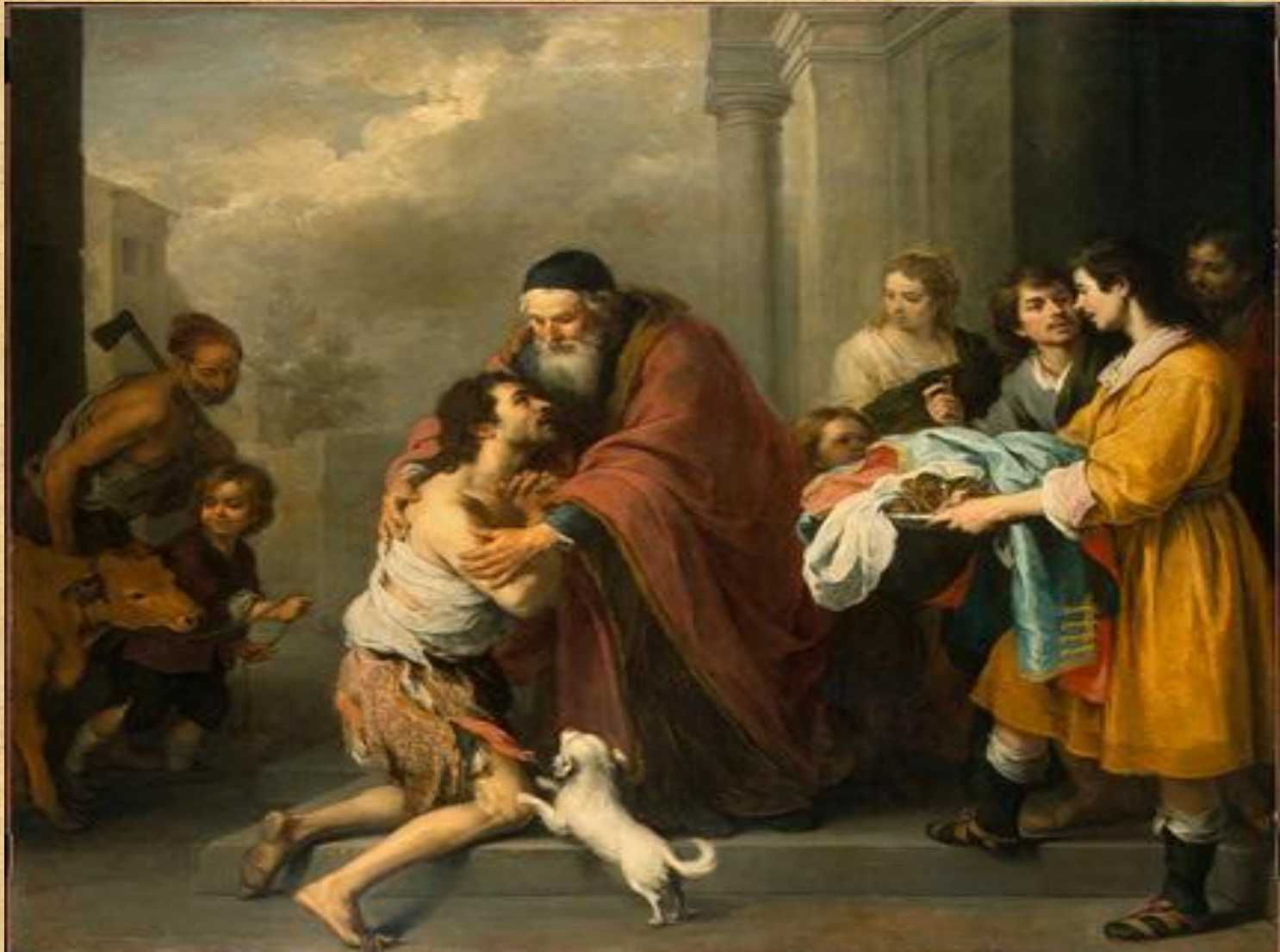
«Возвращение блудного сына» Бартоломео