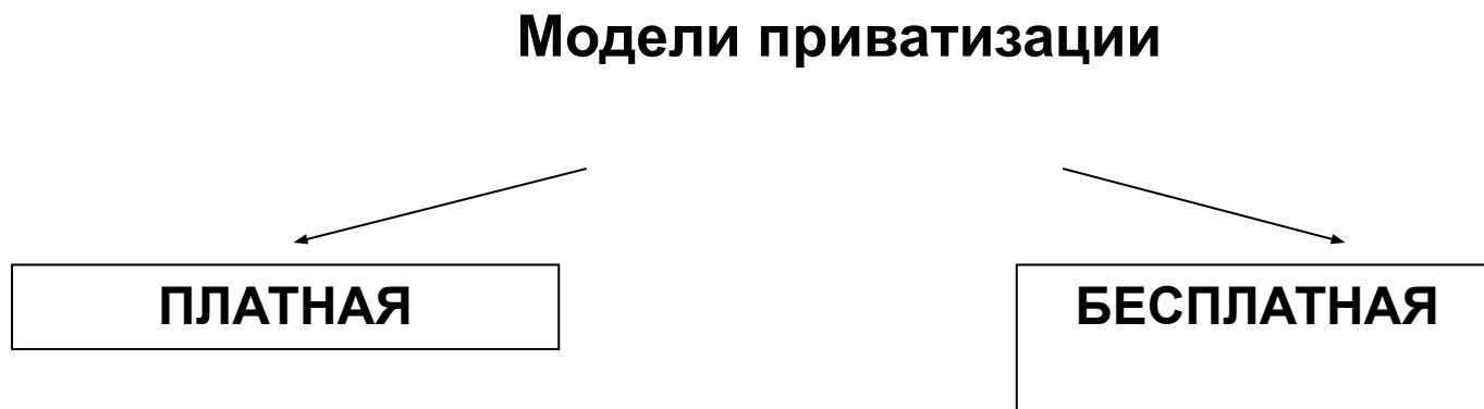
Рисунок 2. – Модели приватизации