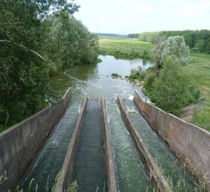
Памятник инженерного искусства - заводская плотина