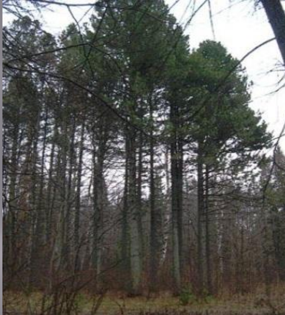
Памятник природы «Урочище Валяй»