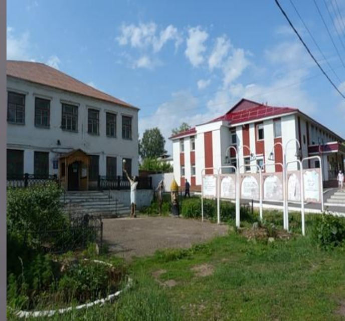
Музей истории и культуры

Главным украшением и достопримечательностью Камбарки являются дома Купцов Ширшова и Вавилова.