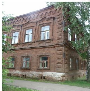
Дом купца Ширшова.