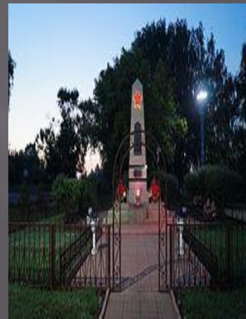
Памятник героям революции