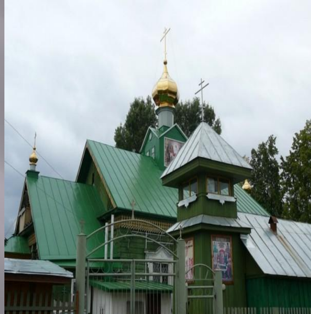
деревянная Успенская церковь