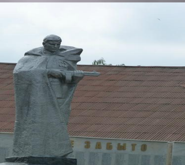
Воинам города Камбарки, погибшим в Великой Отечественной