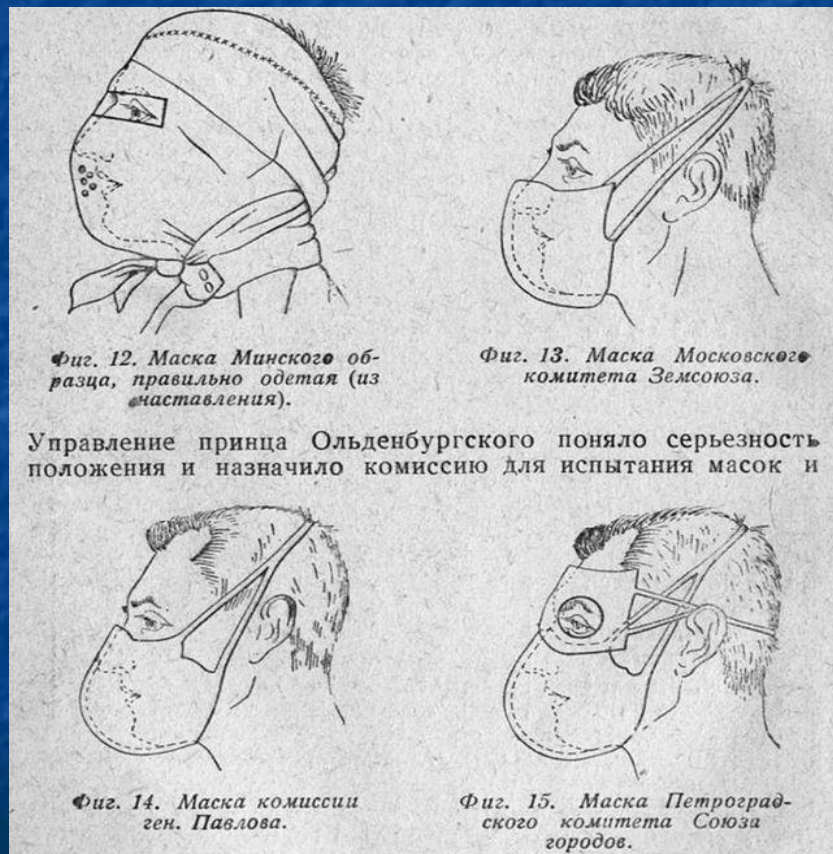
Фиг. 12. Маска Минского образца, правильно одетая (из наставления).