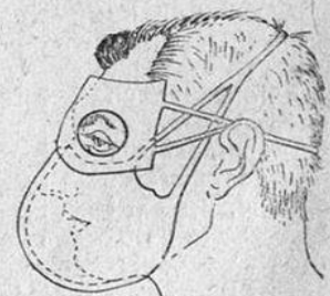
Фиг. 14. Маска комиссии ген. Павлова.