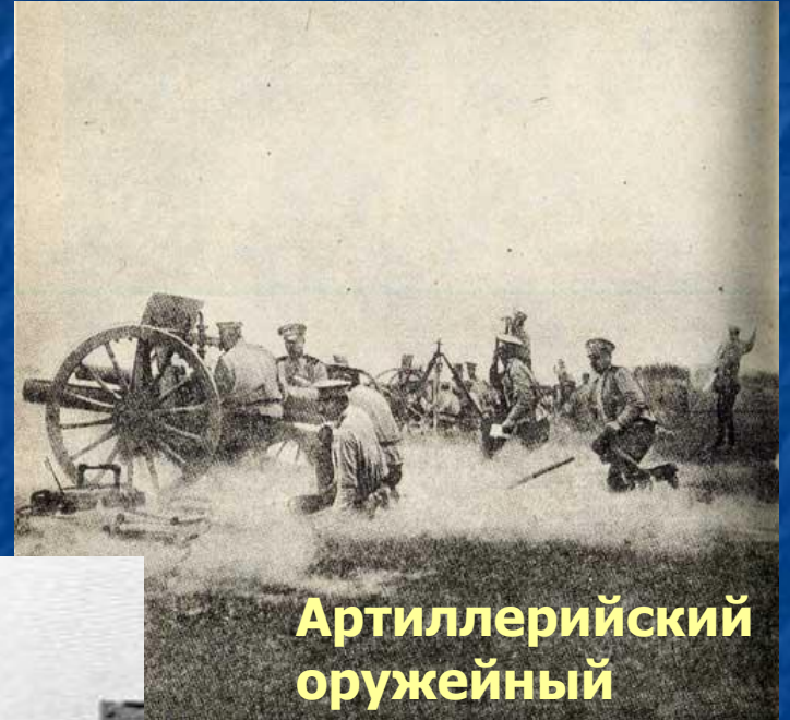
Артиллерийский оружейный огонь