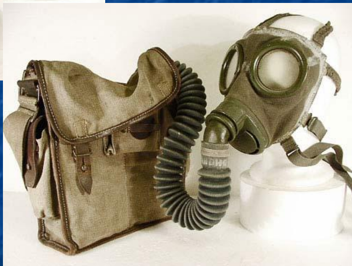
обр. 1924 года