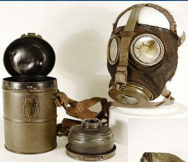
обр. 1915 года