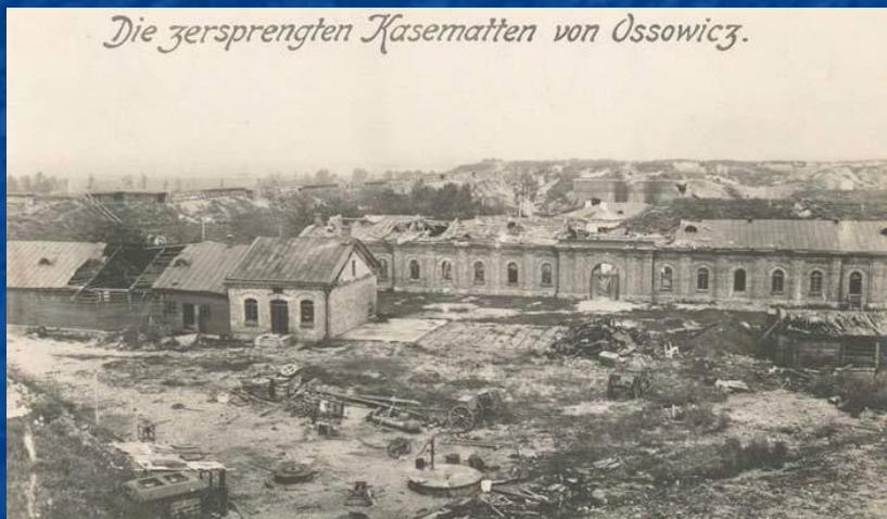
Fort 1 der russ. Festung Ossowicz. Kehlkaserne im Zentralwerk der Festung mit bombensicheren Fenstern.