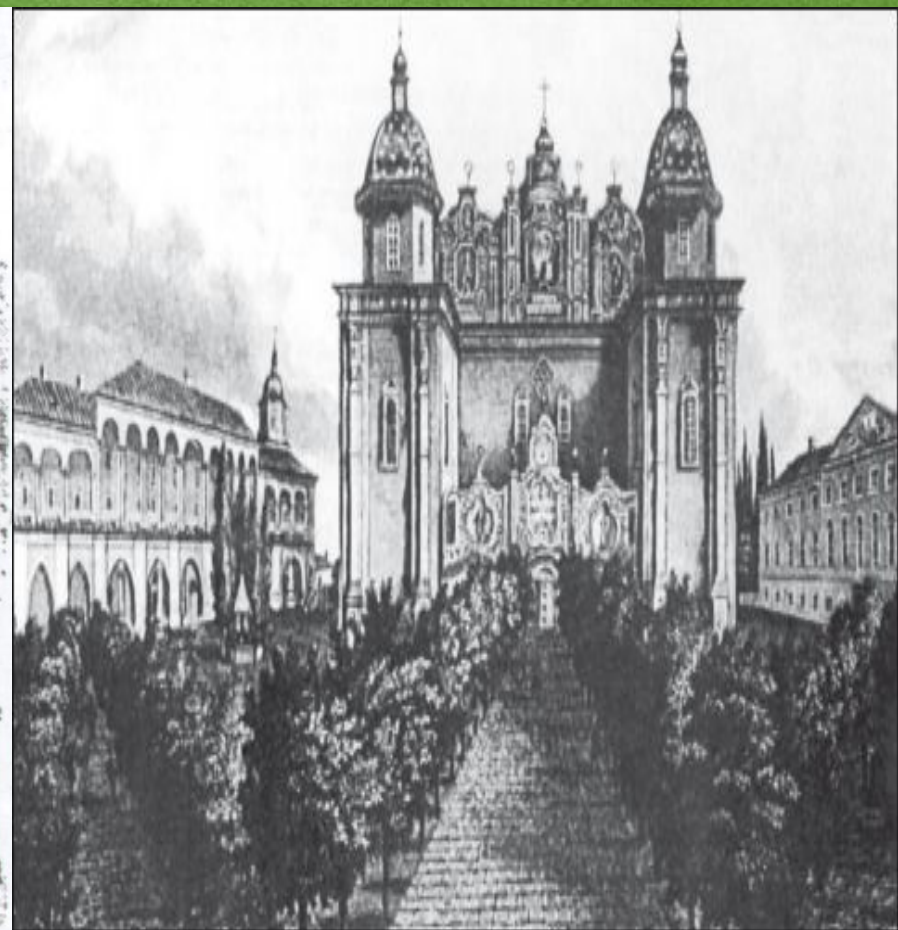
Києво-Могилянська колегія (академія)