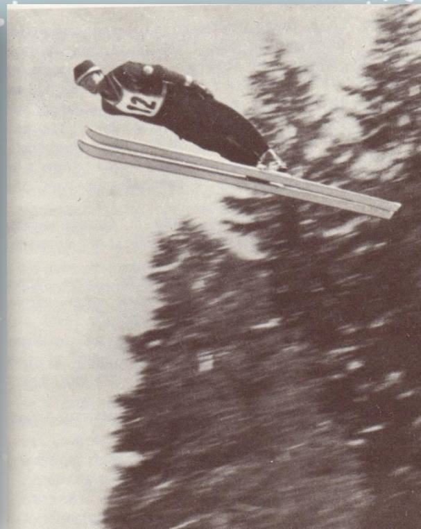
Прыжки с трамплина