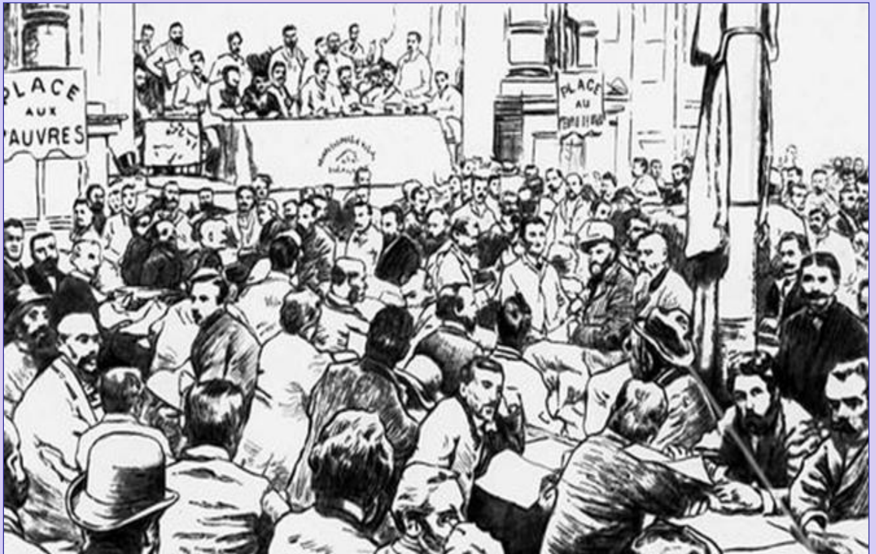
Брюссельський конгрес 2-го Інтернаціоналу (1891)