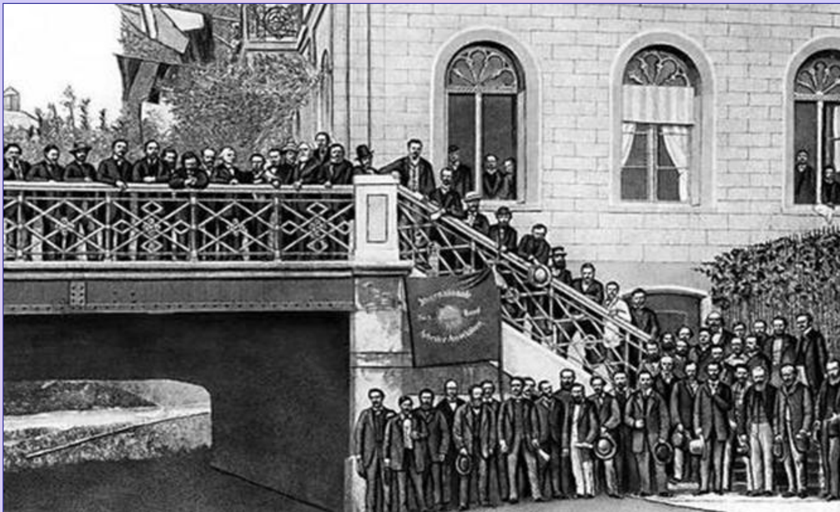
Учасники Базельського конгресу I-го Інтернаціоналу 1869 р.