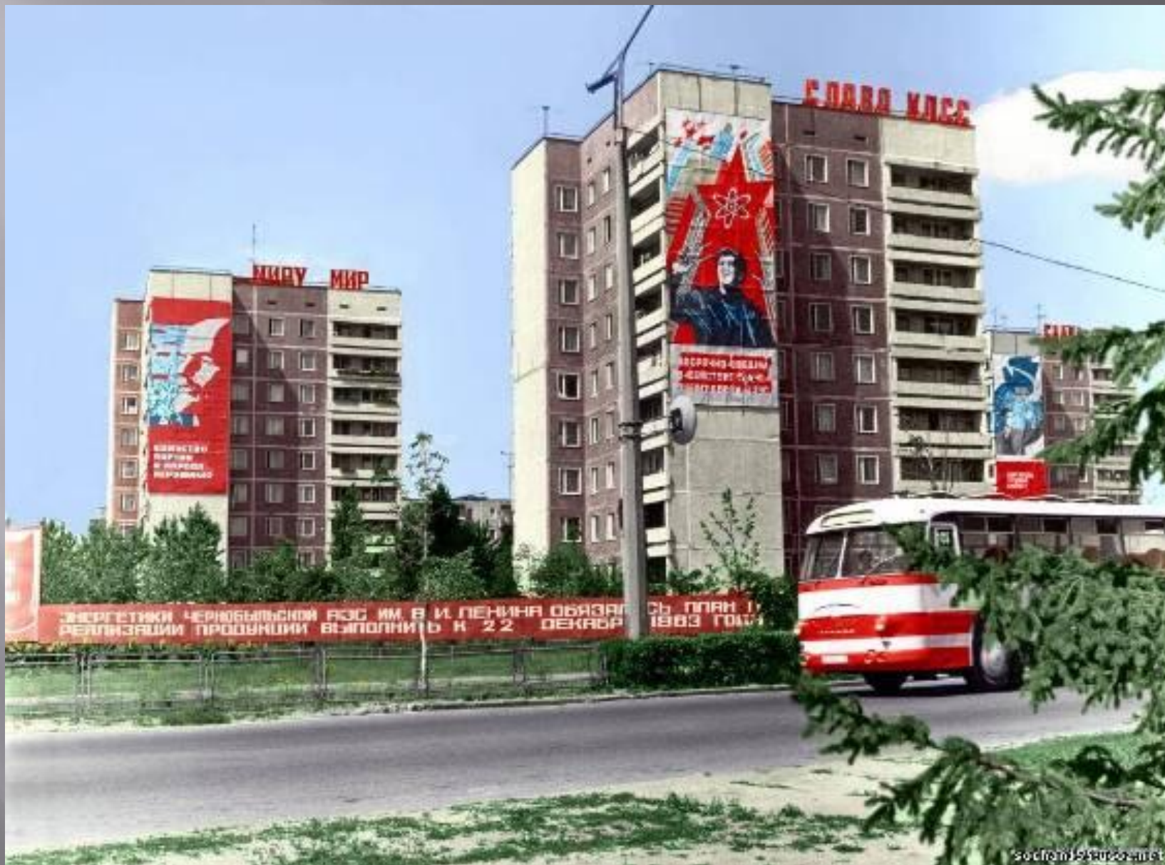
Улицы Припяти до 26 апреля 1986 года