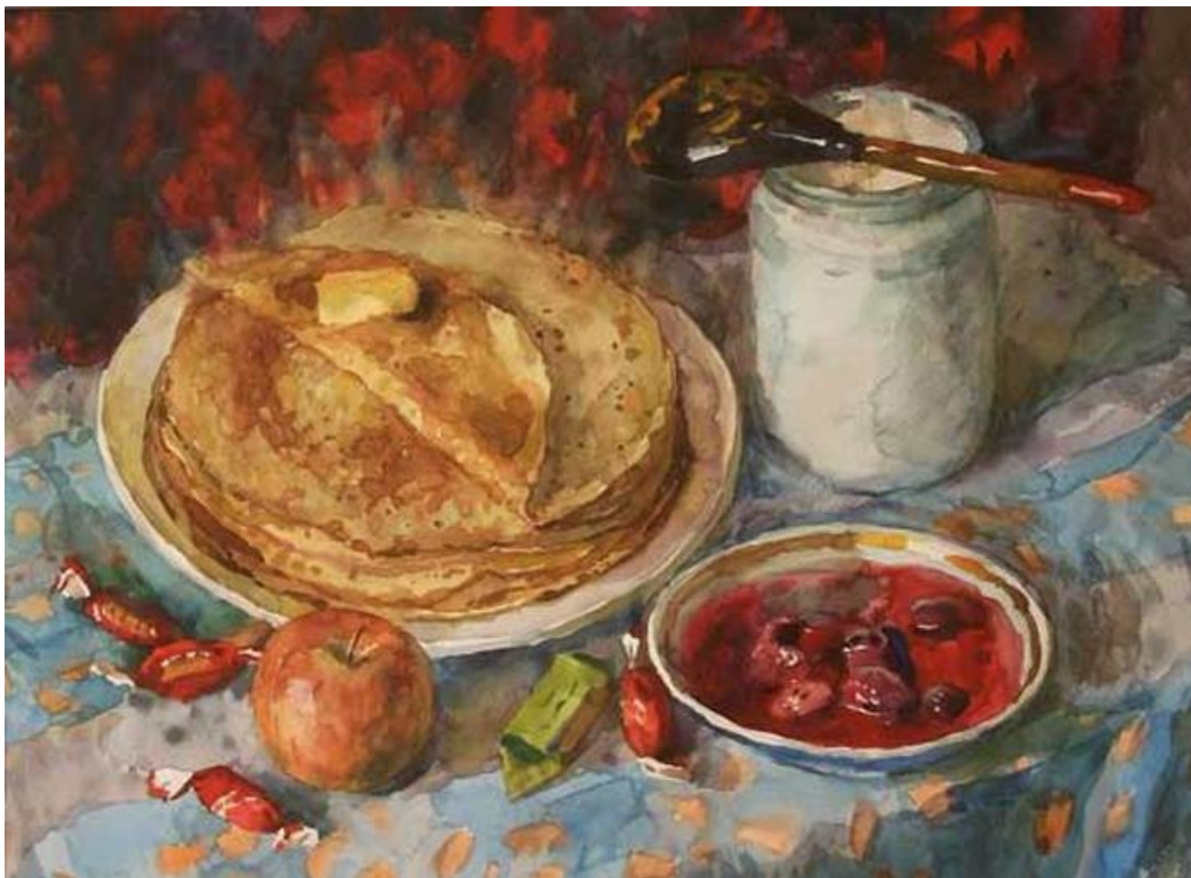
А.Черкашина. "Масленица", 2002 г.