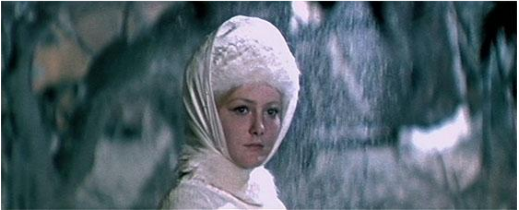
Кадр из кинофильма «Снегурочка»