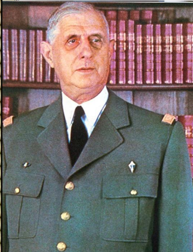
Шарль де Голль

Шарль де Голль – руководитель движения «Свободная Франция»