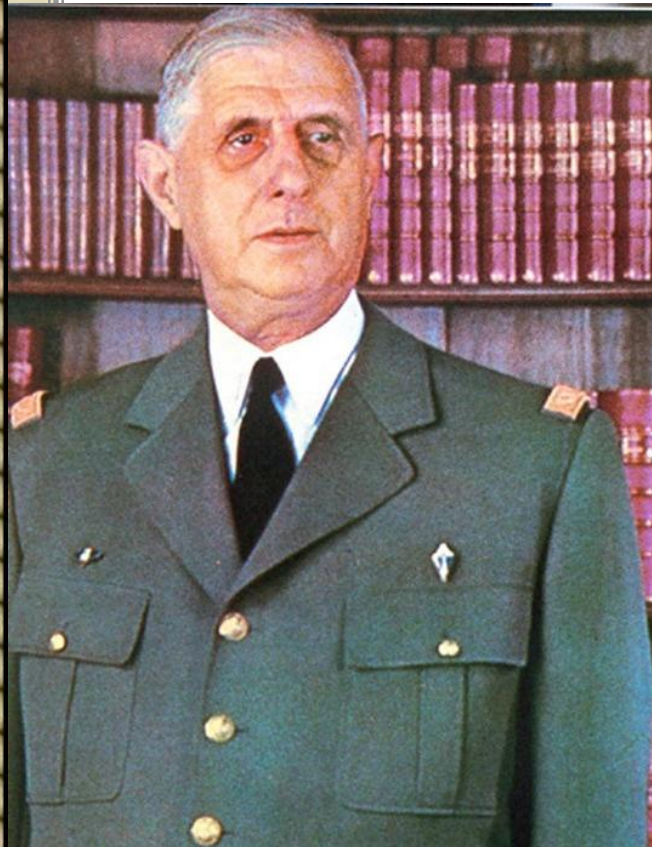
Шарль де Голль

Шарль де Голль лично участвовал в разработке новой конституции В 1958 г. – принята новая Конституция (на референдуме за нее проголосовали 4/5 французов), началась Пятая республика.