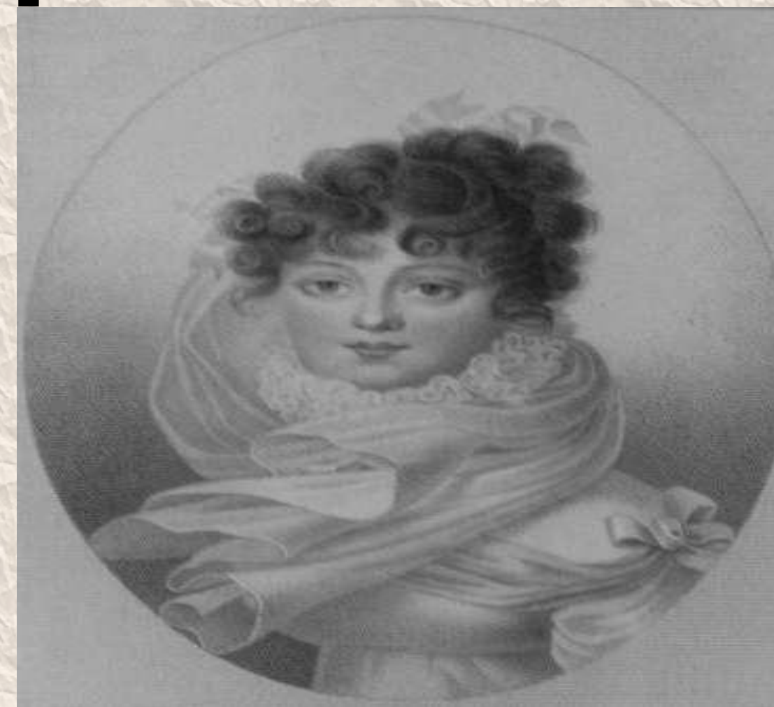
Екатерина Павловна (1788–1819), великая княжна, четвертая дочь императора Павла I