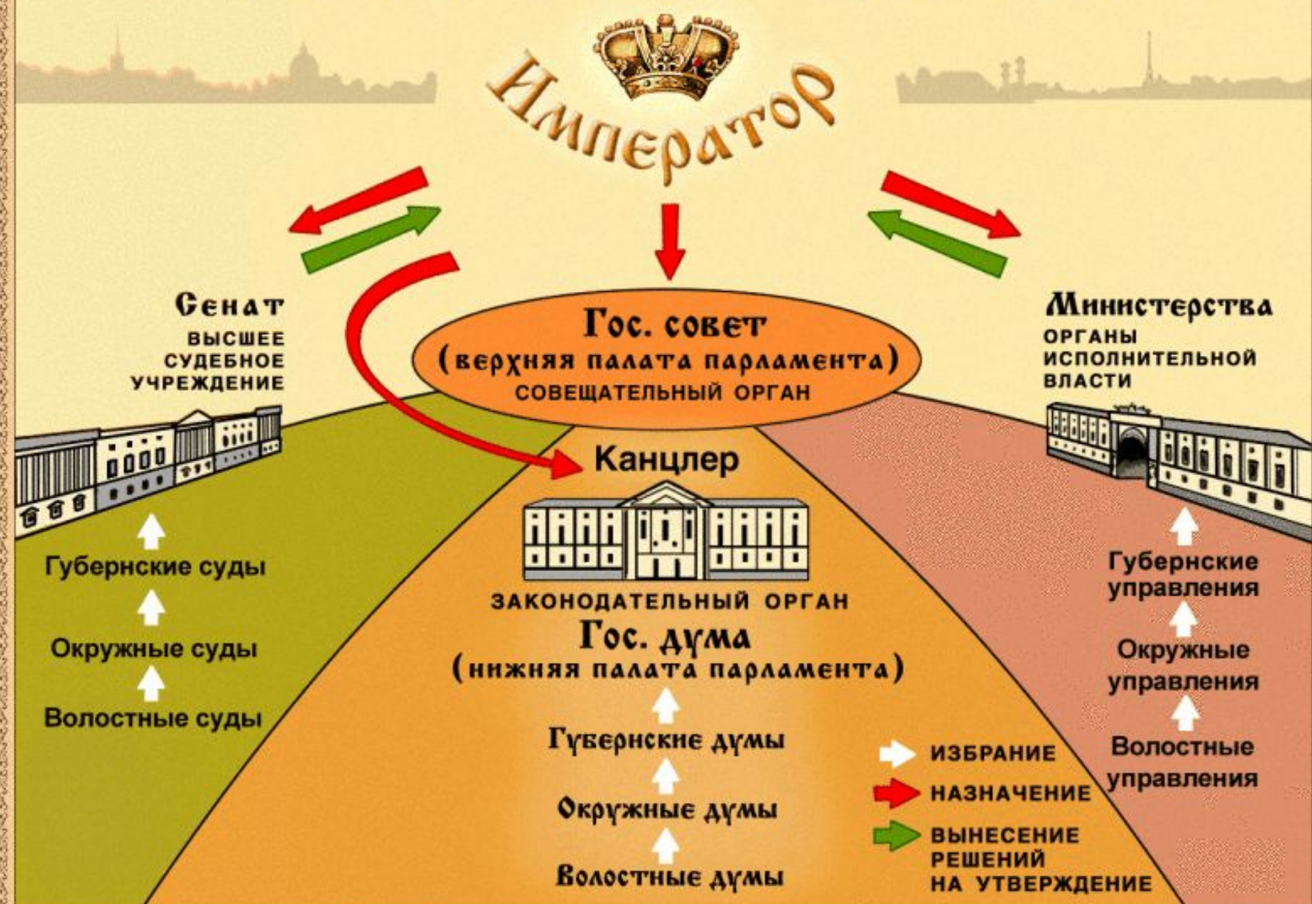
Система управления Российским государством по проекту М.М. Сперанского