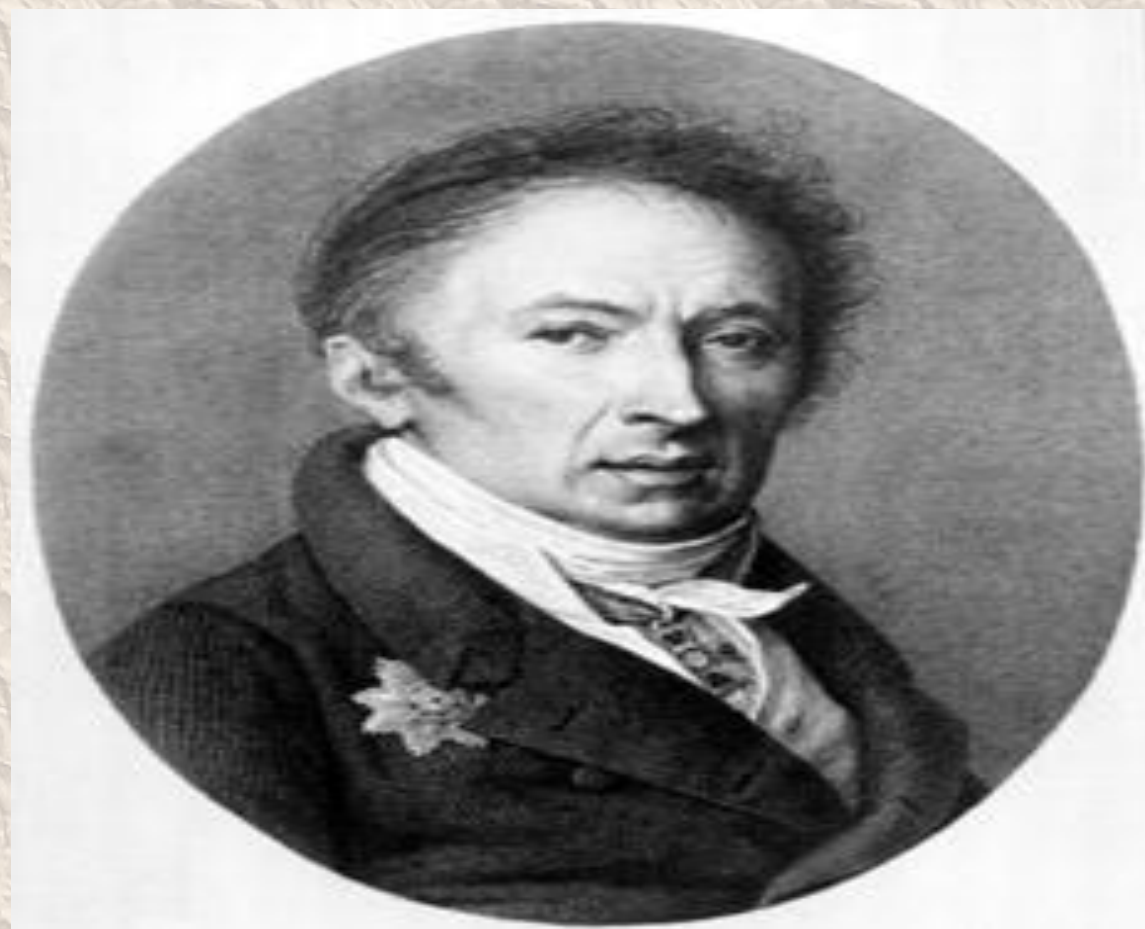
Николай Михайлович Карамзин (1766–1826), писатель, государственный историограф Российской империи