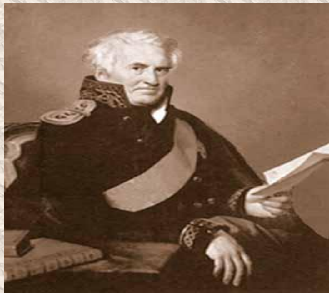
Александр Семенович Шишков (1754–1841), адмирал, писатель, основатель литературного общества «Беседы любителей русского