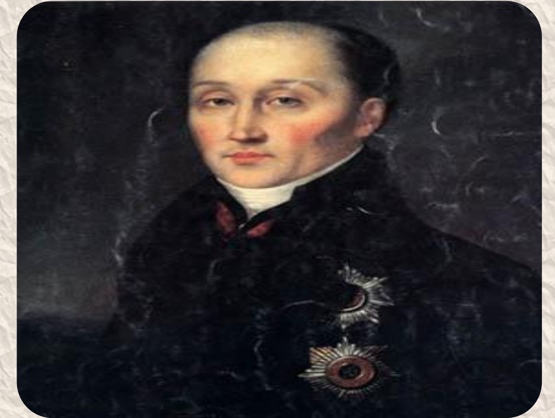
Михаил Михайлович Сперанский