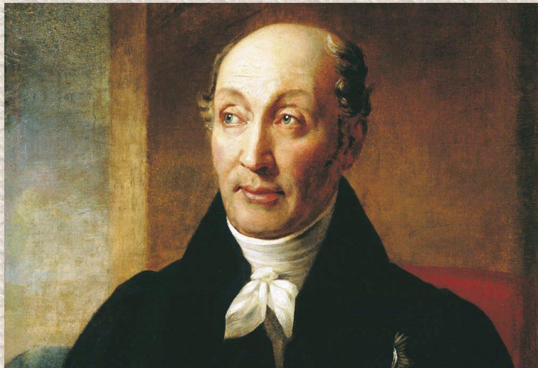
Михаил Михайлович Сперанский