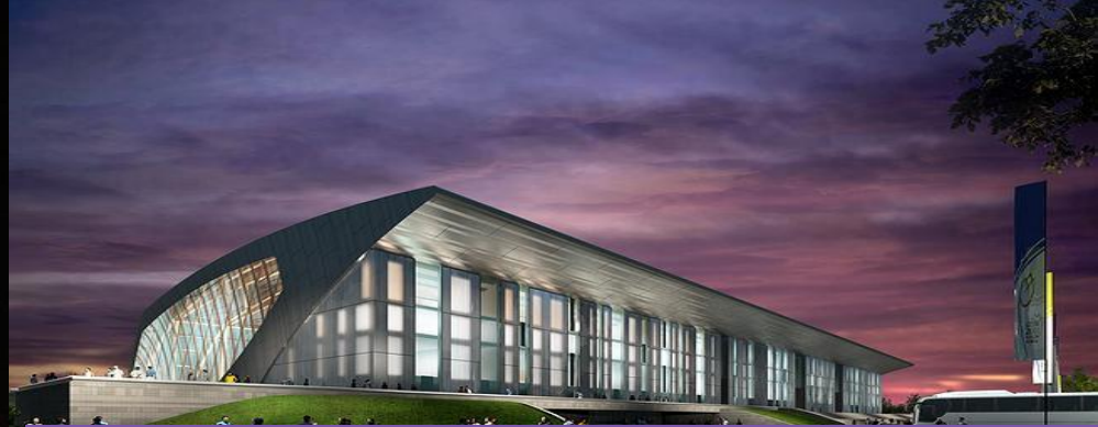
Palace of Water Sports Су спорт төрләре сарае