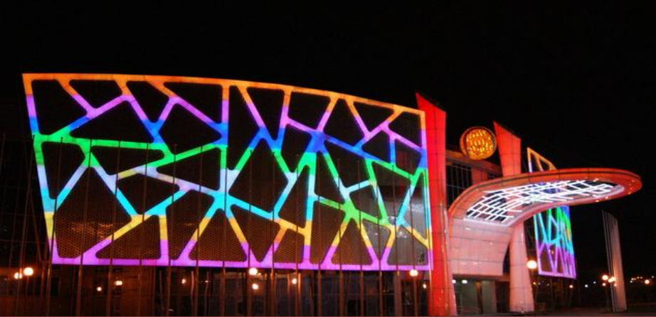
Kazan Academy of Tennis Казан теннис академиясе