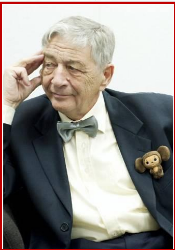
Эдуард Николаевич Успенский