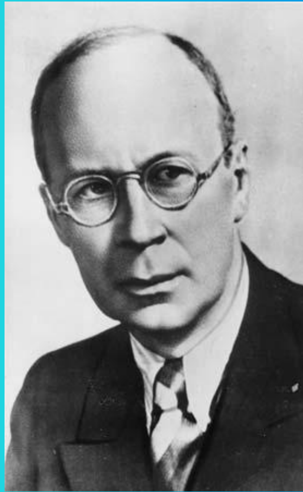
Сергей Сергеевич Прокофьев