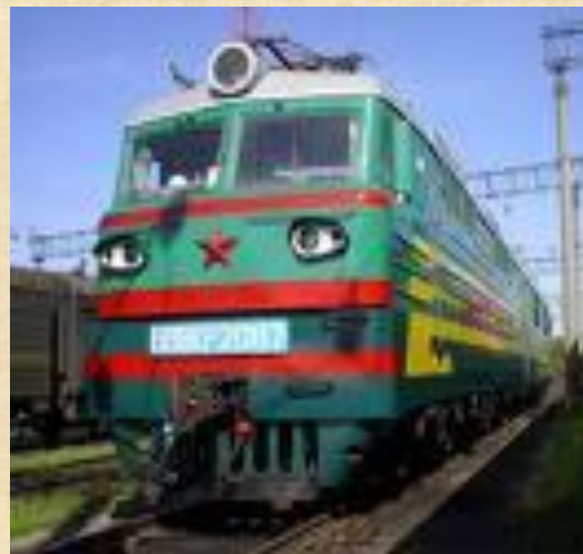
наземный вид рельсового транспорта