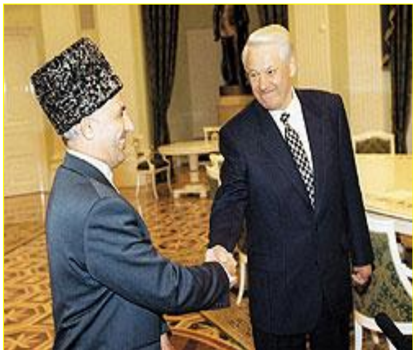
Ельцин и Масхадов

В сентябре 1996 г. в Хасавьюрте были подписаны соглашения о замораживании чеченской проблемы на 5 лет, между Ельциным и Масхадовым, новым лидером Ичкерии.