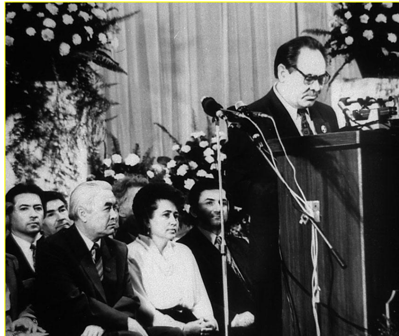
Выступление президента Татарстана М.Шаймиева.