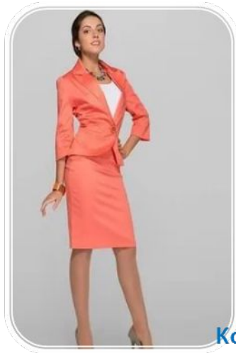
Костюм второго типа