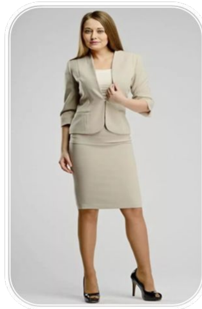
Костюм четвертого типа