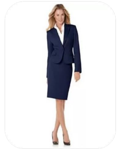
Костюм пятого типа