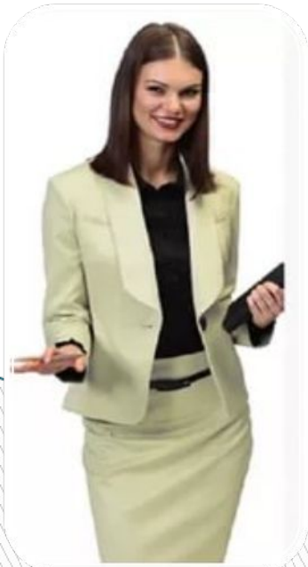
Костюм третьего типа