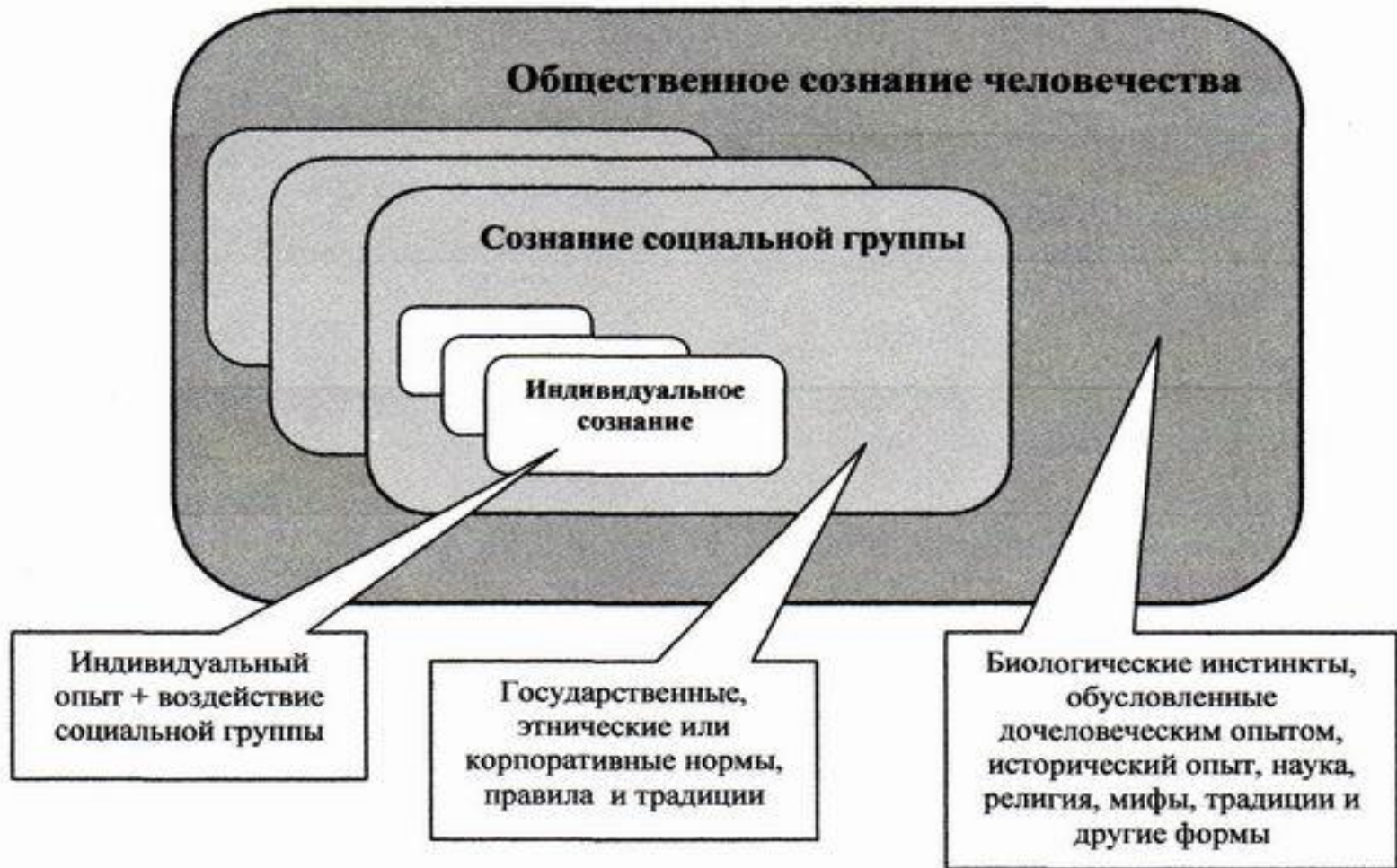
Рис. 18.2 Уровни общественного сознания.