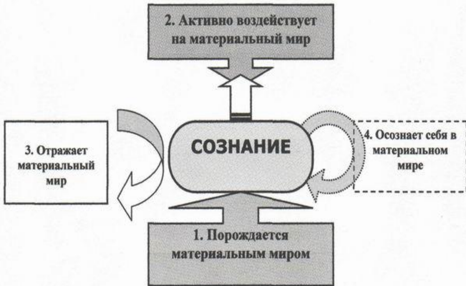
Рис. 18.4 Схема взаимодействия сознания с материальным миром