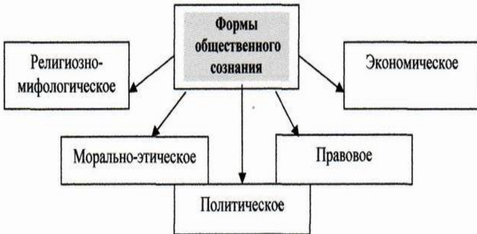
Рис. 18.3 Основные формы общественного сознания