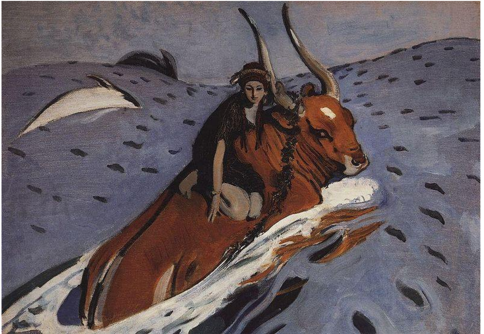
В.А.Серов. «Похищение Европы». 1910 г. Модерн.