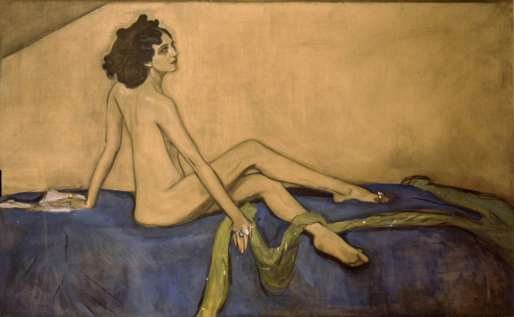
В.А.Серов. «Портрет Иды Рубинштейн. (российская танцовщица и актриса )1910 г. Модерн