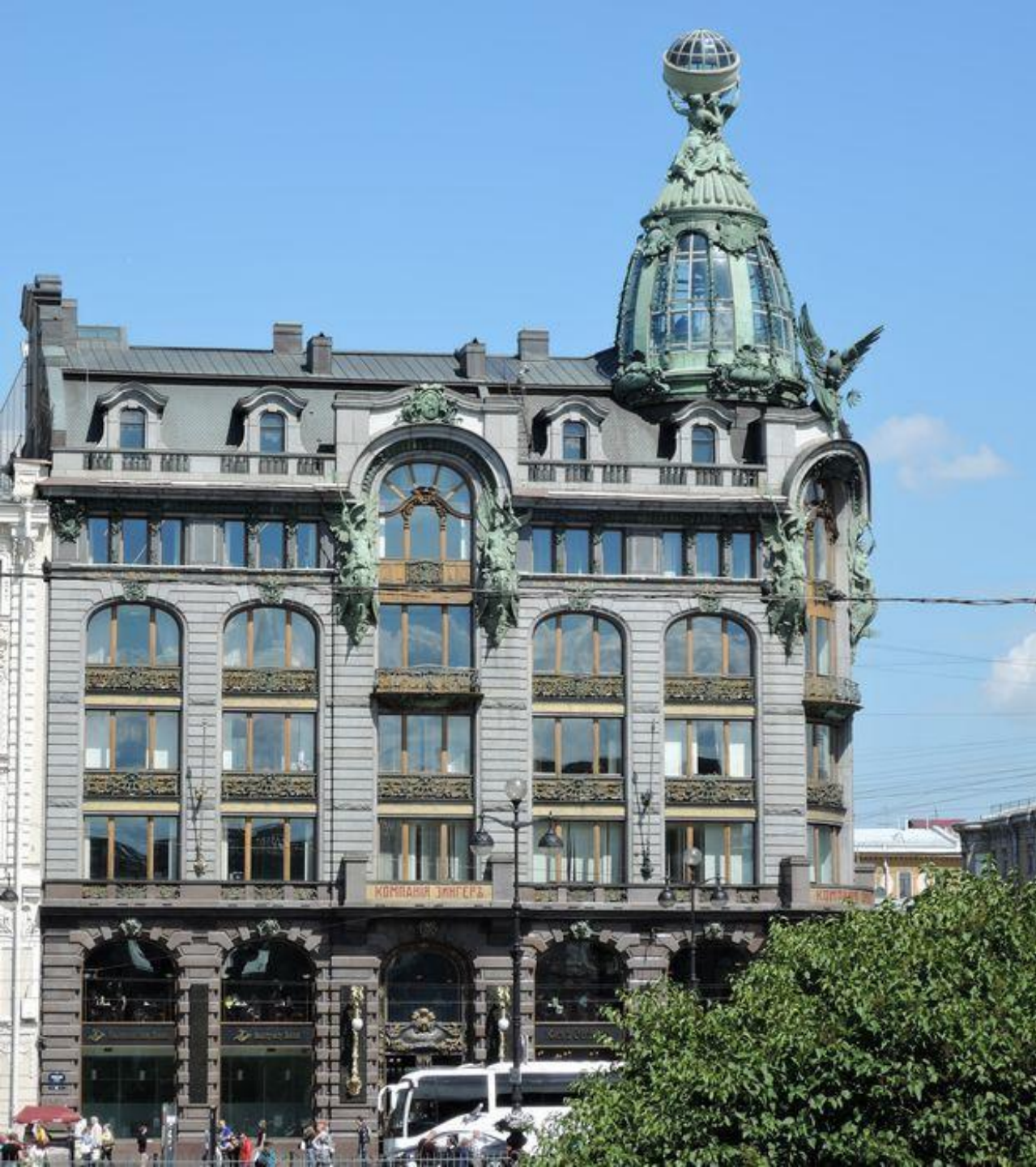
П.Ю. Сюзор. Здание акционерного общества « Зингер и К° » (Дом книги). 1902—1904. Санкт-Петербург. Модерн.