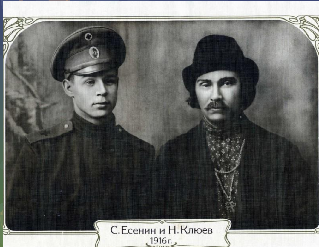
С.Есенин и Н.Клюев 1916г.

Клюев и Есенин в течение полутора лет совместно выступают и в прессе, и на чтениях. Клюев становится духовным наставником молодого поэта, всячески ему протезирует. Вокруг них собирается кружок «новокрестьянских» писателей, но попытки организационно закрепить содружество не приводят к созданию долговечного и прочного объединения (общества «Краса» и «Страда» просуществовали лишь несколько месяцев).