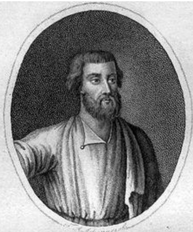
Козьма Мининъ, Грибоданинъ Нижегородскій, потомъ Душный Дворянинъ.