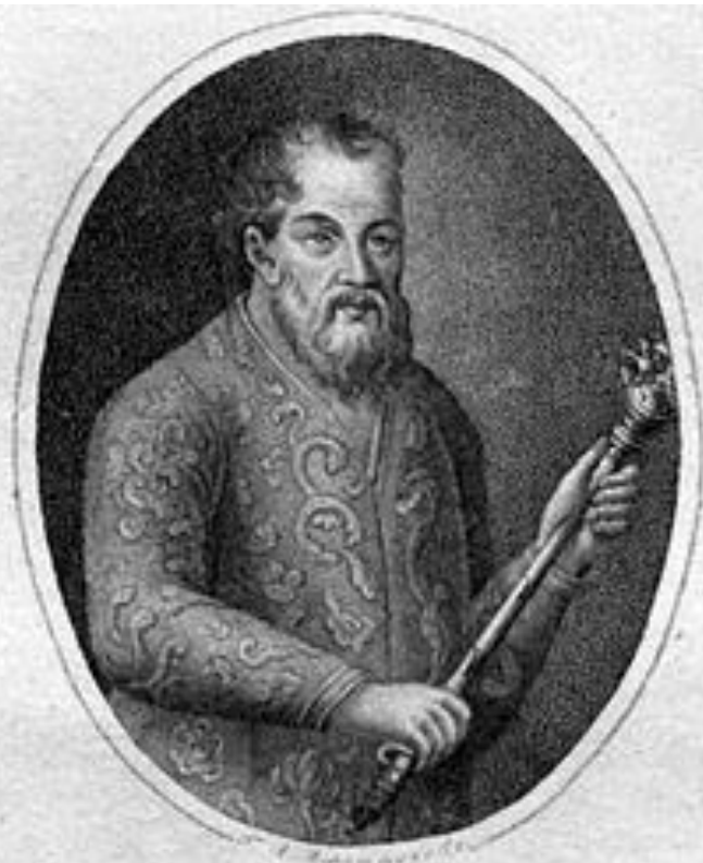
Князь Димитрій Михайловичъ Пожарскій, Бояринъ.