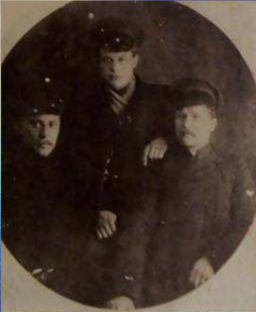
Студенти Глухівського учительського інституту. Серед них - О. Довженко (в центрі). Фото 1913р.

Довженко зі студентами Глухівського педагогічного інституту, 1913 рік