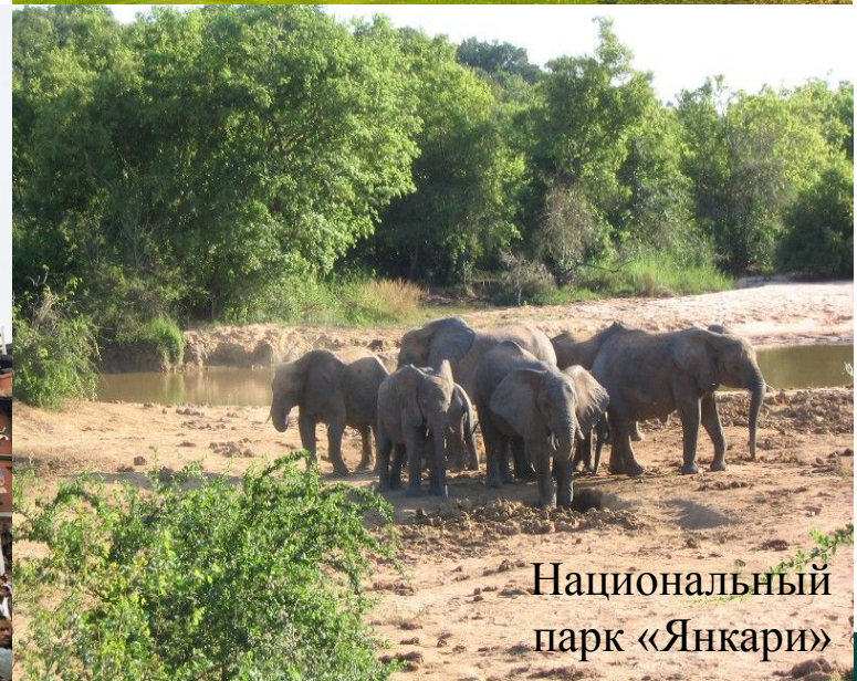
Национальный парк «Янкари»