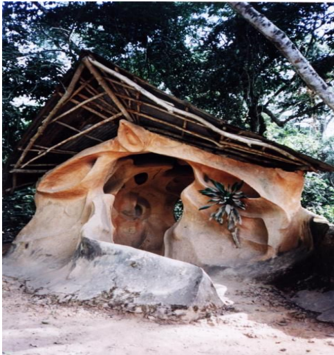
Объект всемирного наследия — Осун-Осогбо