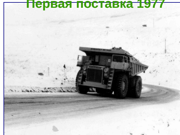
Первая поставка 1977