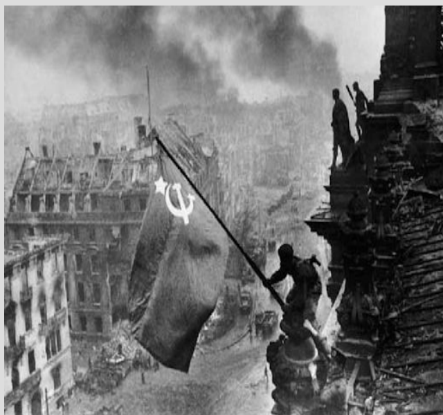
Знамя Победы взвилось над Рейхстагом 30 апреля