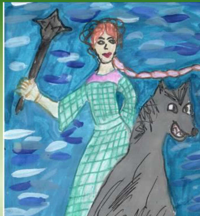
Рисунок Байталжи Ксении

За свободу донской земли борется девица- казачка Светланка, дочка храброго казака Степана, она вместе с отцом поехала на войну биться с Чудом- Чудищем.