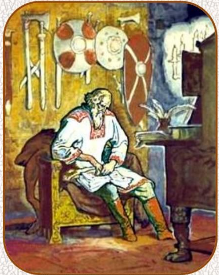
Великий князь Владимир Мономах.

Владимир Мономах оставил замечательное произведение: «Поучение чадам своим». Текст «Поучения» обнаружен в Лаврентьевской летописи, которая, как вы помните, написана в 1377 году. В каком году Владимир писал свое «Поучение», точно неизвестно. Из «Поучения» мы можем узнать о детстве и юности Владимира, о его верности православной вере, о его любви к церковной службе и молитве, заботе о своих подданных, об отношении к самому себе и другим людям.