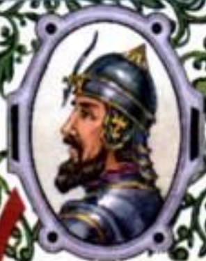
Александр Невский (1220—1263) великий князь Владимирский с 1252 г.