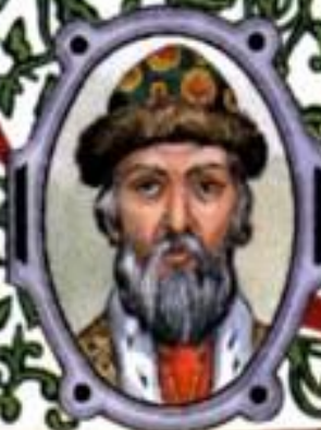
Даниил Александрович (1261—1303) князь Московский с 1276 г.