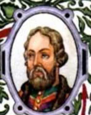
Иван Красный (1326—1359) великий князь Владимирский и Московский с 1353 г.