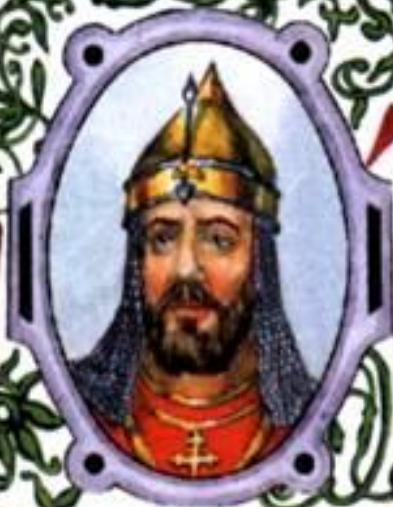
Дмитрий Донской (1350—1389) великий князь Московский с 1359 г., великий князь Владимирский с 1362 г.