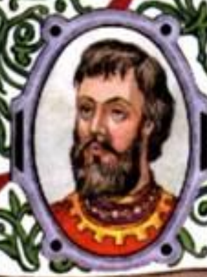
Иван Калита (?—1340) князь Московский с 1325 г. князь Владимирский с 1328 г.