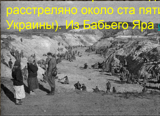
Babi Jar, 29./30. 9. 1941 – Erschießung von 33 771 jüdischen Menschen.

Бабий яр - место массовых расстрелов гражданского населения, главным образом евреев Бабий яр - место массовых расстрелов гражданского населения, главным образом евреев, цыган Бабий яр - место массовых расстрелов гражданского населения, главным образом евреев, цыган, а также советских военнопленных Бабий яр - место массовых расстрелов гражданского населения, главным образом евреев, цыган, а также советских военнопленных, осуществлённых немецкими оккупационными войсками Бабий яр - место массовых расстрелов гражданского населения, главным образом евреев, цыган, а также советских военнопленных, осуществлённых немецкими оккупационными войсками и украинскими коллаборационниками Всего было расстреляно свыше ста тысяч человек (по мнению некоторых исследователей - около ста пятидесяти тысяч человек (в том числе и граждан Украины). Из Бабьего Яра спаслось