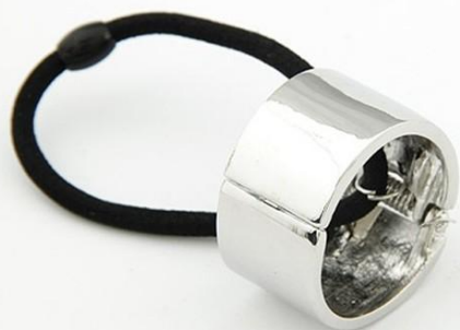
Декоративная резинка для волос