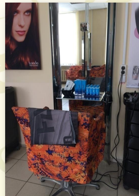
Рабочее место парикмахера