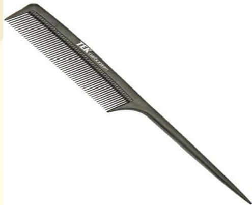
Расчёска с остроконечной ручкой «хвостик»