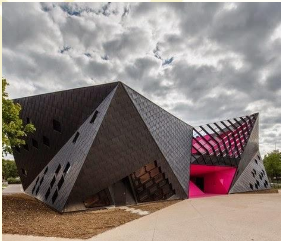
Культурный центр в городе Мюлуз