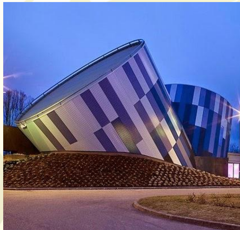
Здания театра в Париже (Гранд Опера)