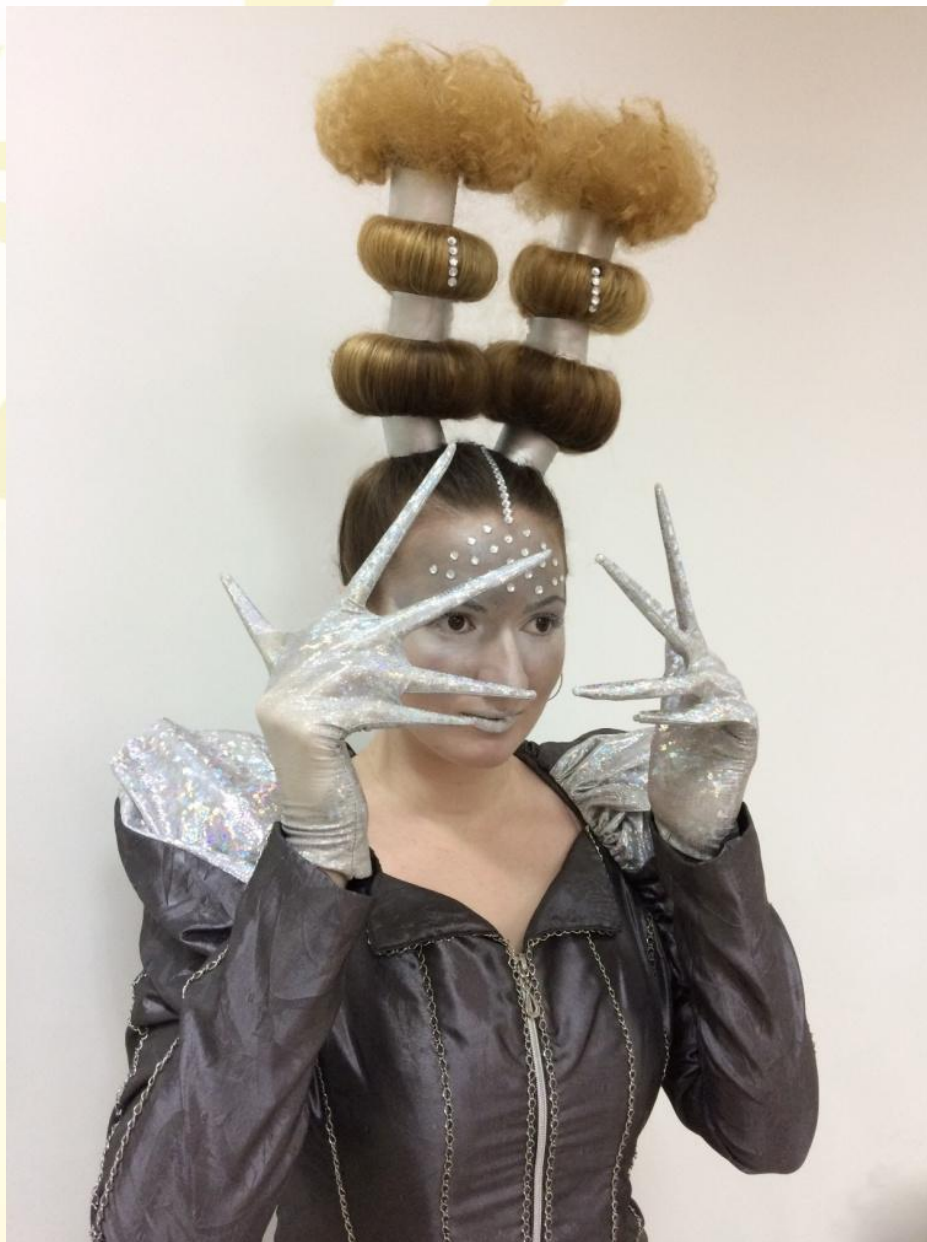
Женская прическа в авангардном стиле