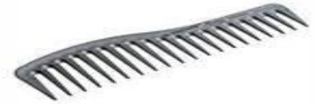
Расчёска с однородным расположением зубьев «гребень»