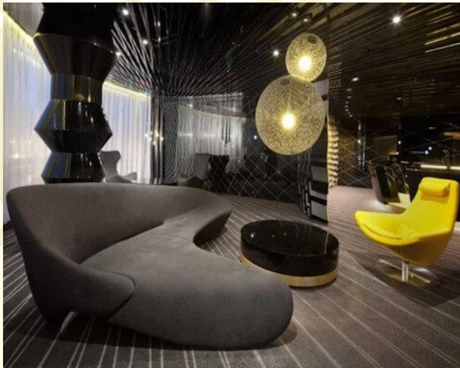
Интерьер в авангардном стиле