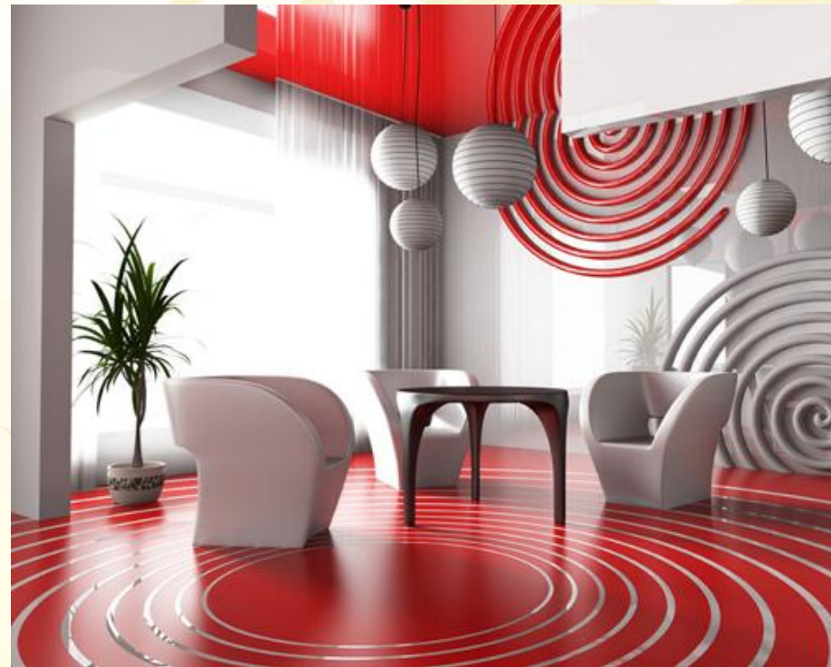
Декор в авангардном стиле