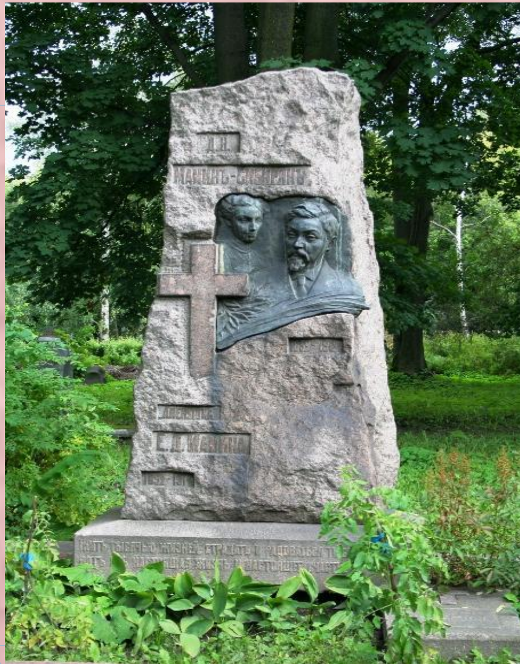
Памятник на могиле писателя