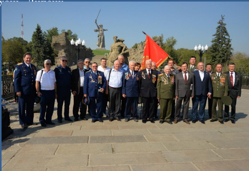
Ветераны Подмосковья на Мамаевом кургане в Волгограде

Ветераны Подмосковья участвовали в мероприятиях, посвящённых 75-летию освобождения Белгорода и Курска от немецко-фашистских захватчиков. А до этого они посетили Севастополь, Симферополь, Феодосию, Керчь, Воронеж, Астрахань, Псков.