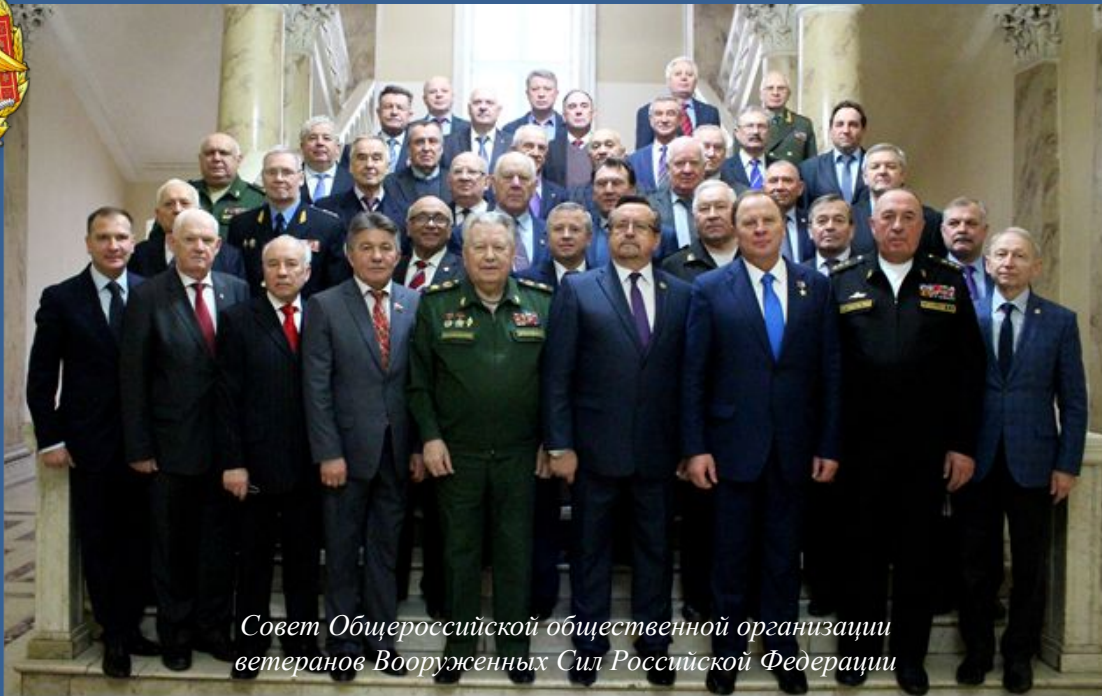
Совет Общероссийской общественной организации ветеранов Вооруженных Сил Российской Федерации

Ощутимый вклад в организацию деятельности Совета вносят сотрудники Аппарата Совета.