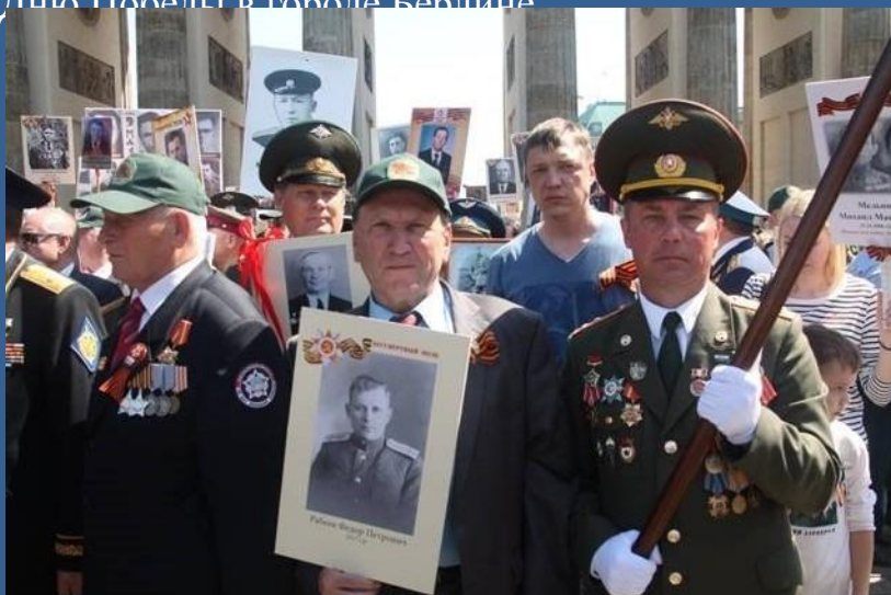
Ветераны Вооруженных Сил приняли участие в шествии «Бессмертного полка» от Бранденбургских ворот до Мемориала Советским воинам-освободителям в Тиргартен-Парке.

9 мая 2018 года делегация Московского областного регионального отделения ОООВ ВС РФ осуществила миссию народной дипломатии и приняла участие в праздничных мероприятиях, посвящённых Дню Победы в городе Бердичеве.