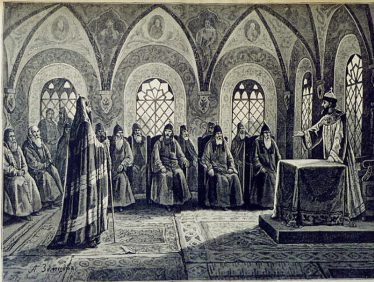
Русская история. Судъ надъ патриархомъ Никономъ. Ориг. рис. (собств. „Левъ“) А. Земцова, грав. Шоблеръ.