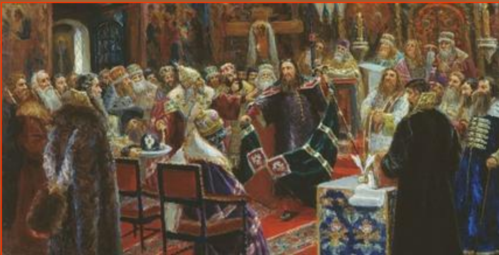
Суд над патриархом Никоном (С. Д. Милорадович, 1885 год)

Собор 1666 года одобрил реформы Никона, но он сам был отправлен в ссылку в Белозёрский Ферапонтов монастырь простым монахом