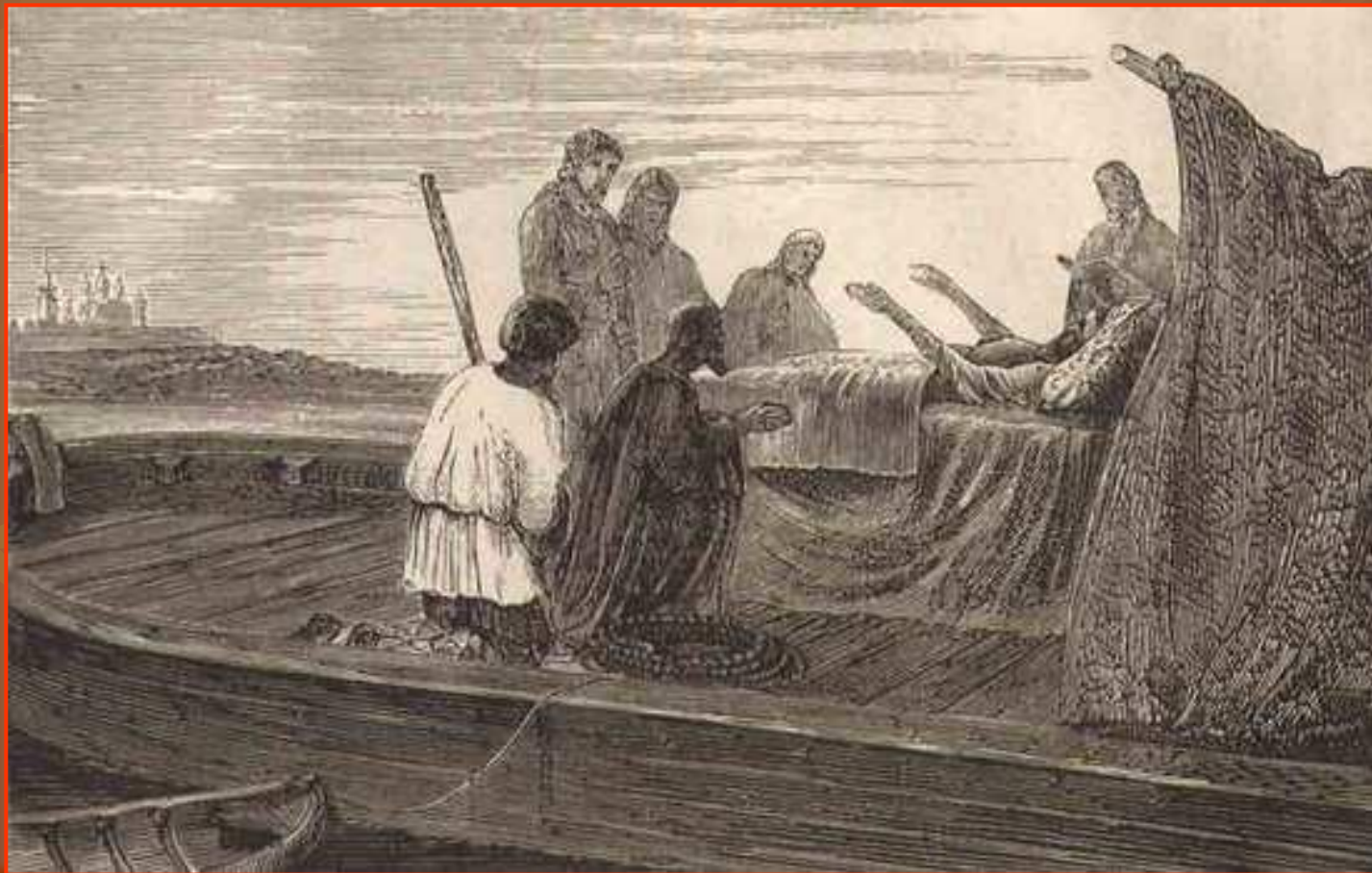
Смерть патриарха Никона (гравюра, 1870-е годы)

В 1681 году Никону разрешили переехать в Вознесенский Новоиерусалимский монастырь. Однако престарелый Никон умер в дороге близ Ярославля 17 августа 1681года.