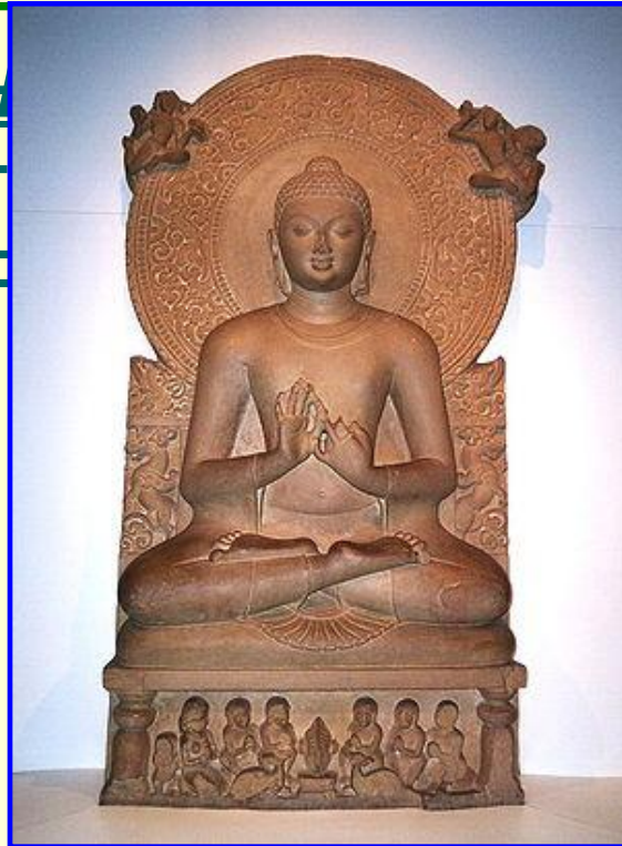
Сидхартха Гаутама Будда