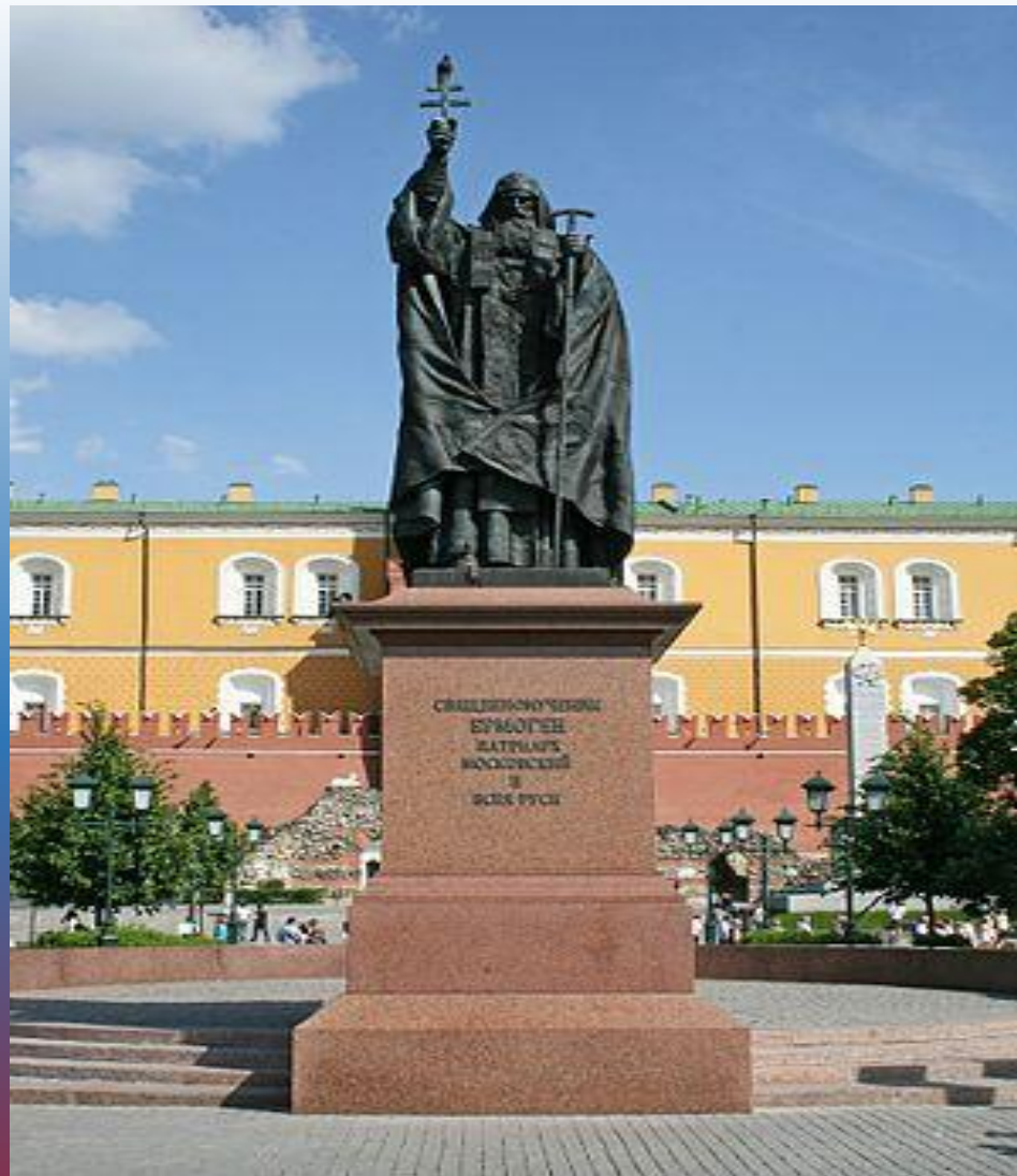
Памятник Патриарху Гермогену.