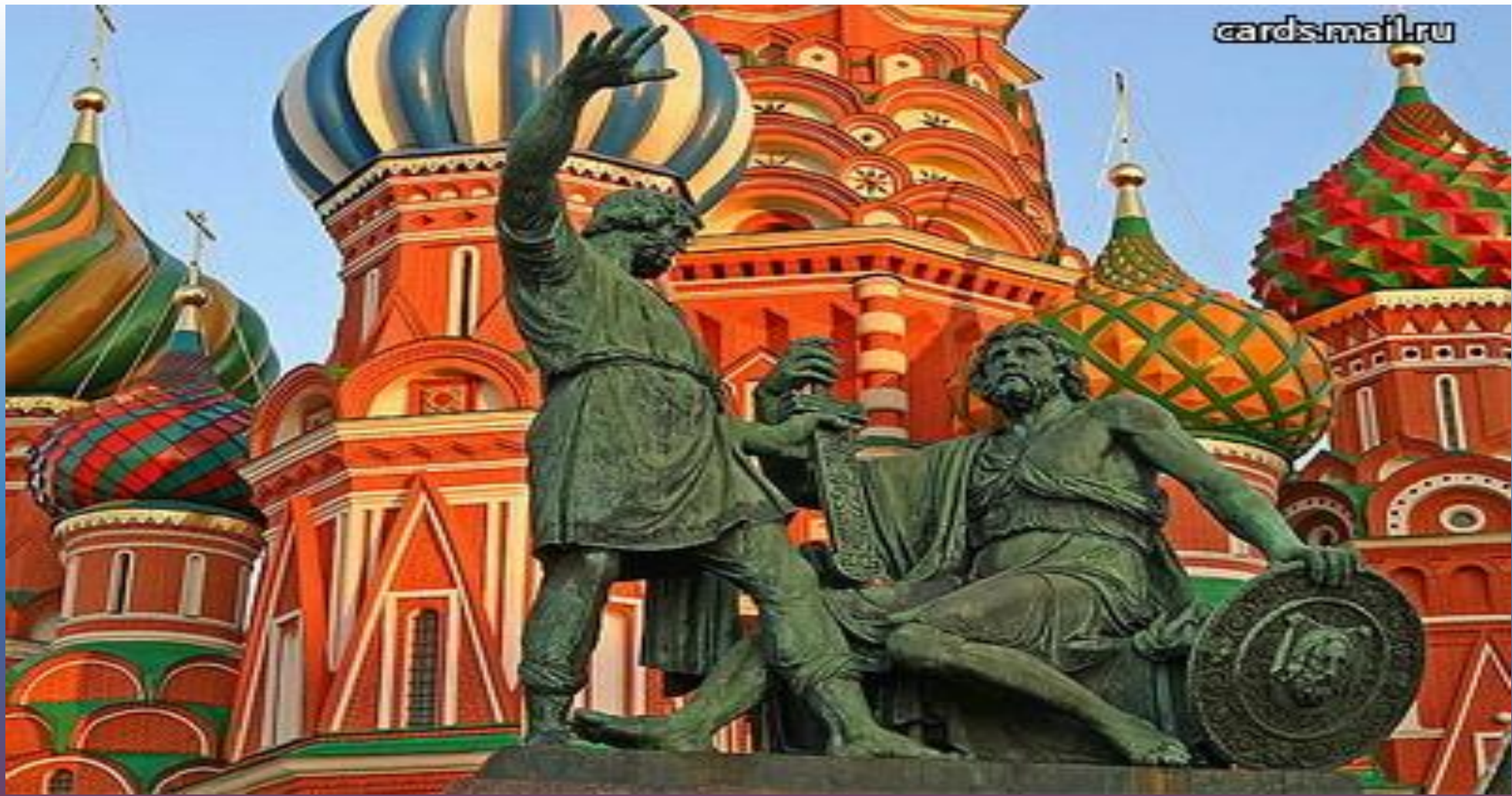
Памятник Козьме Минину и Дмитрию Пожарскому на Красной Площади