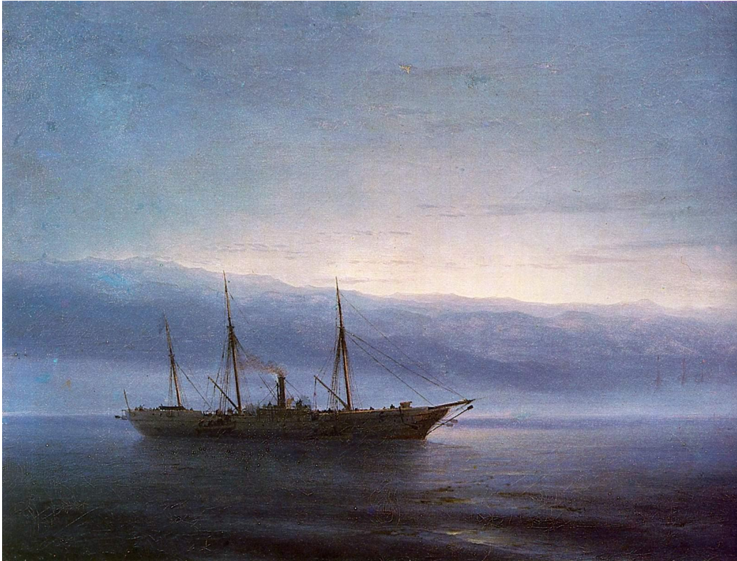
Перед боем Корабль «Константинополь»