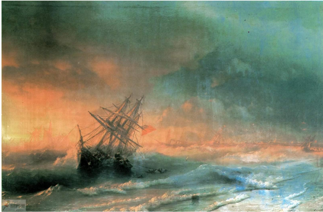
Корабль среди бурного моря.