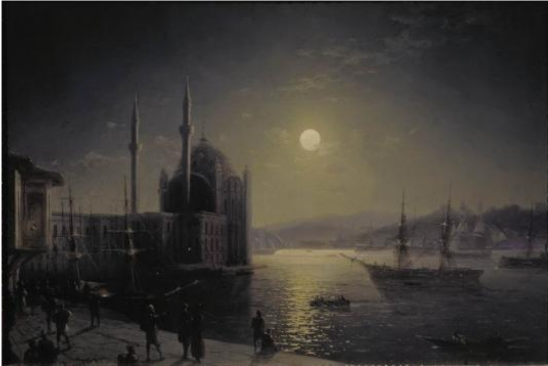
Лунная ночь на Босфоре