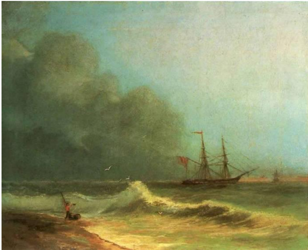
Море перед бурей