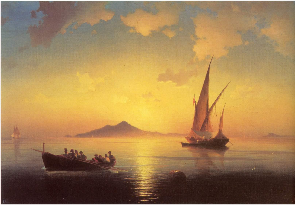
Утро на море