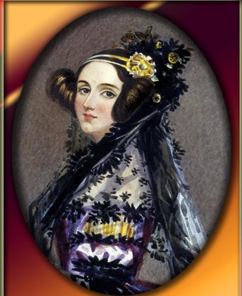
Августа Ада Лавлейс 10.12.1815-27.11.1852