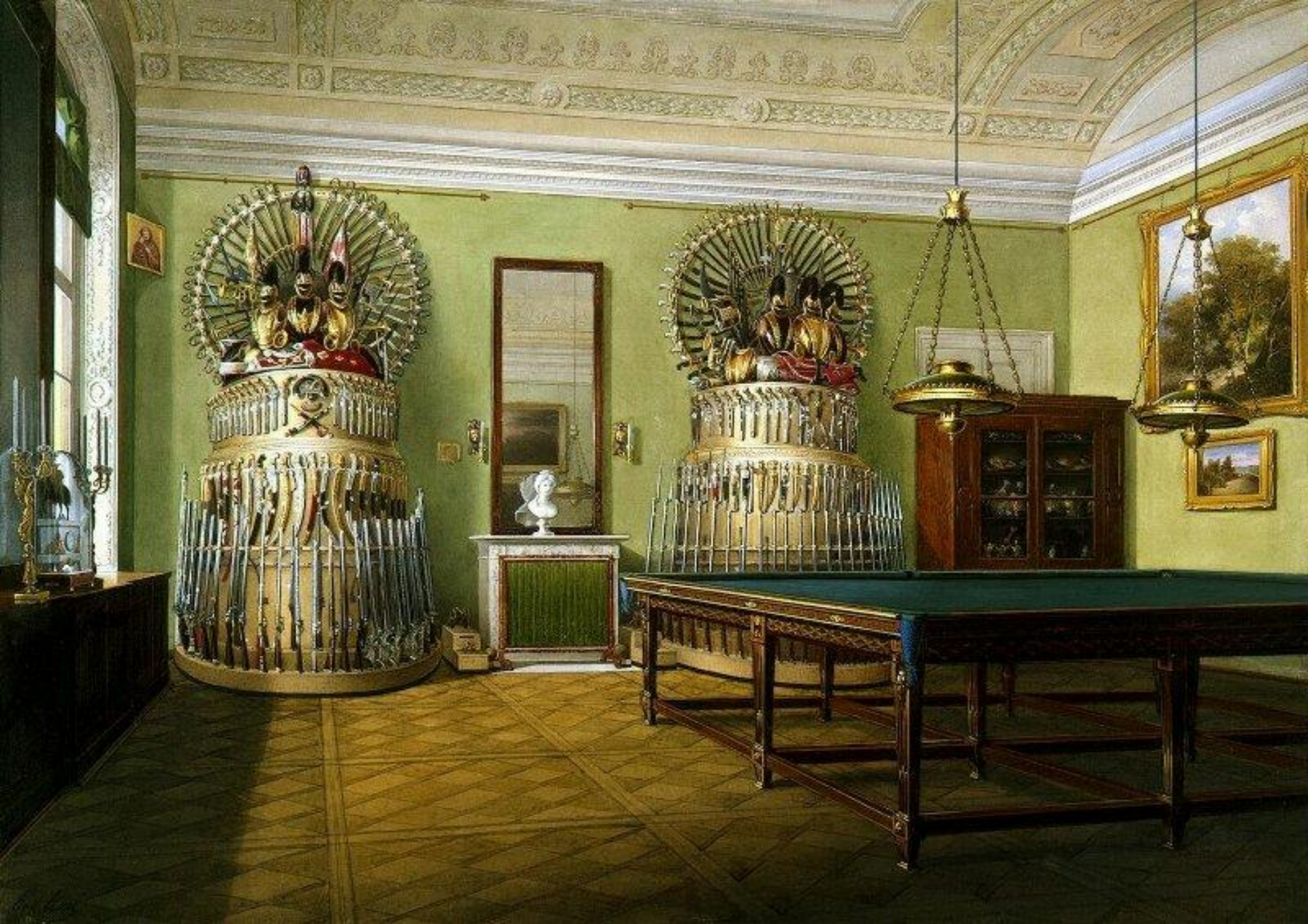
Бильярдная Александра 2