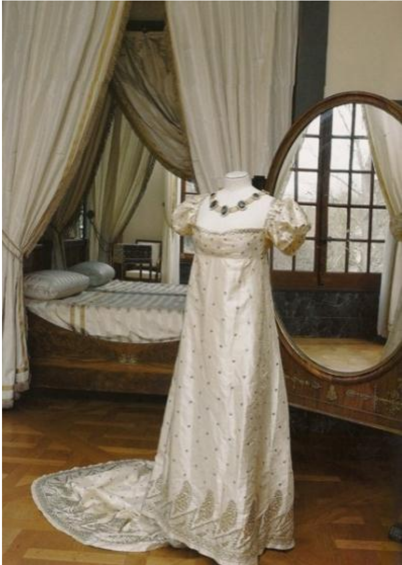
платье Елизаветы Алексеевны