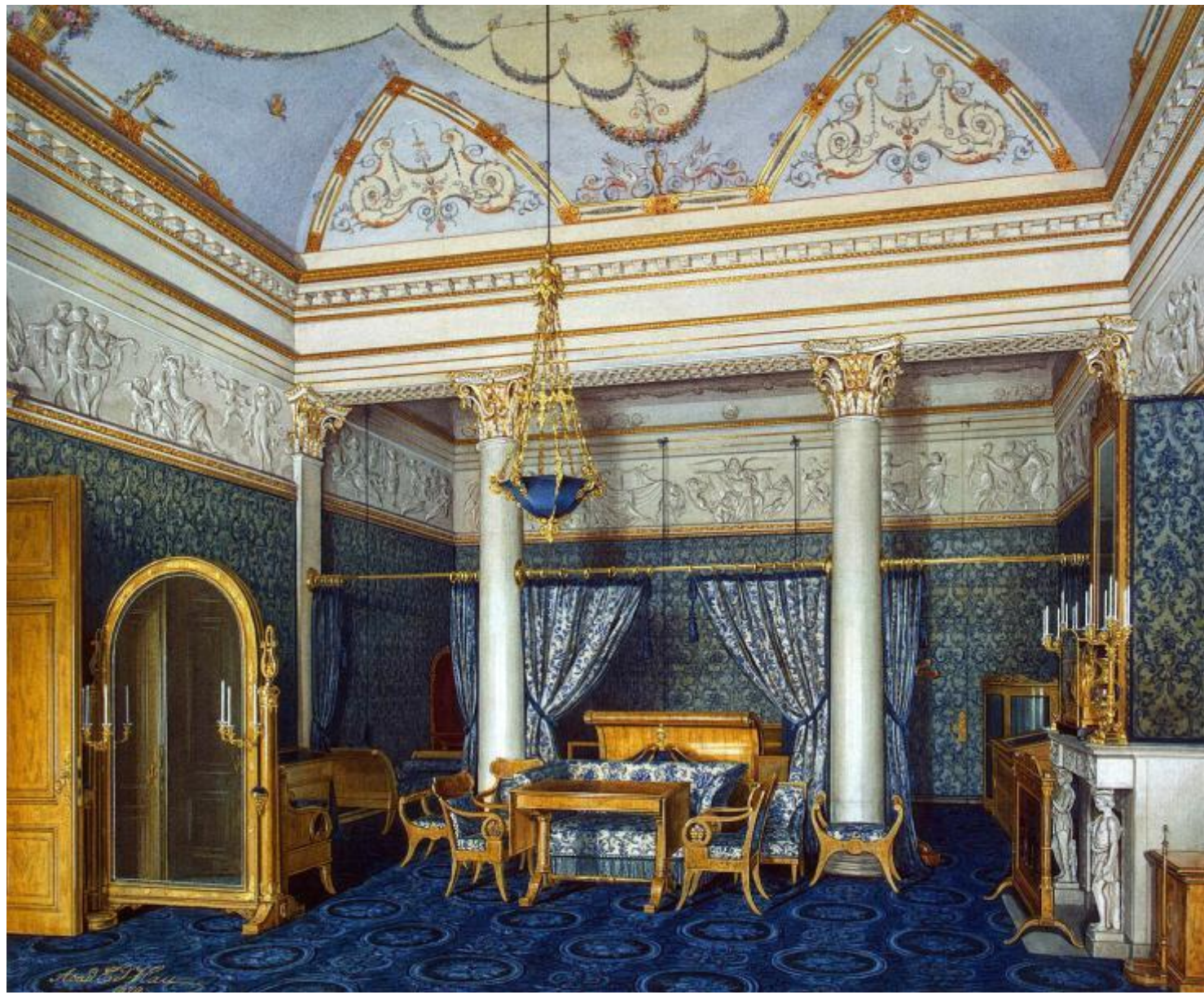
Спальня имп. Александры Федоровны