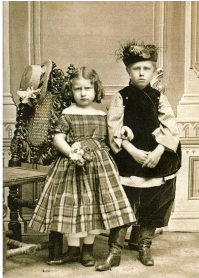
Дети из дворянской семьи