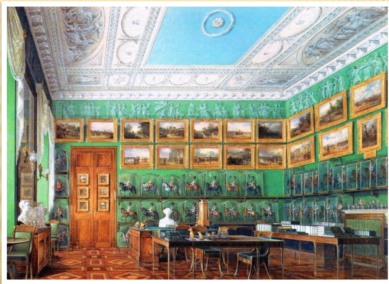
Кабинет Николая I