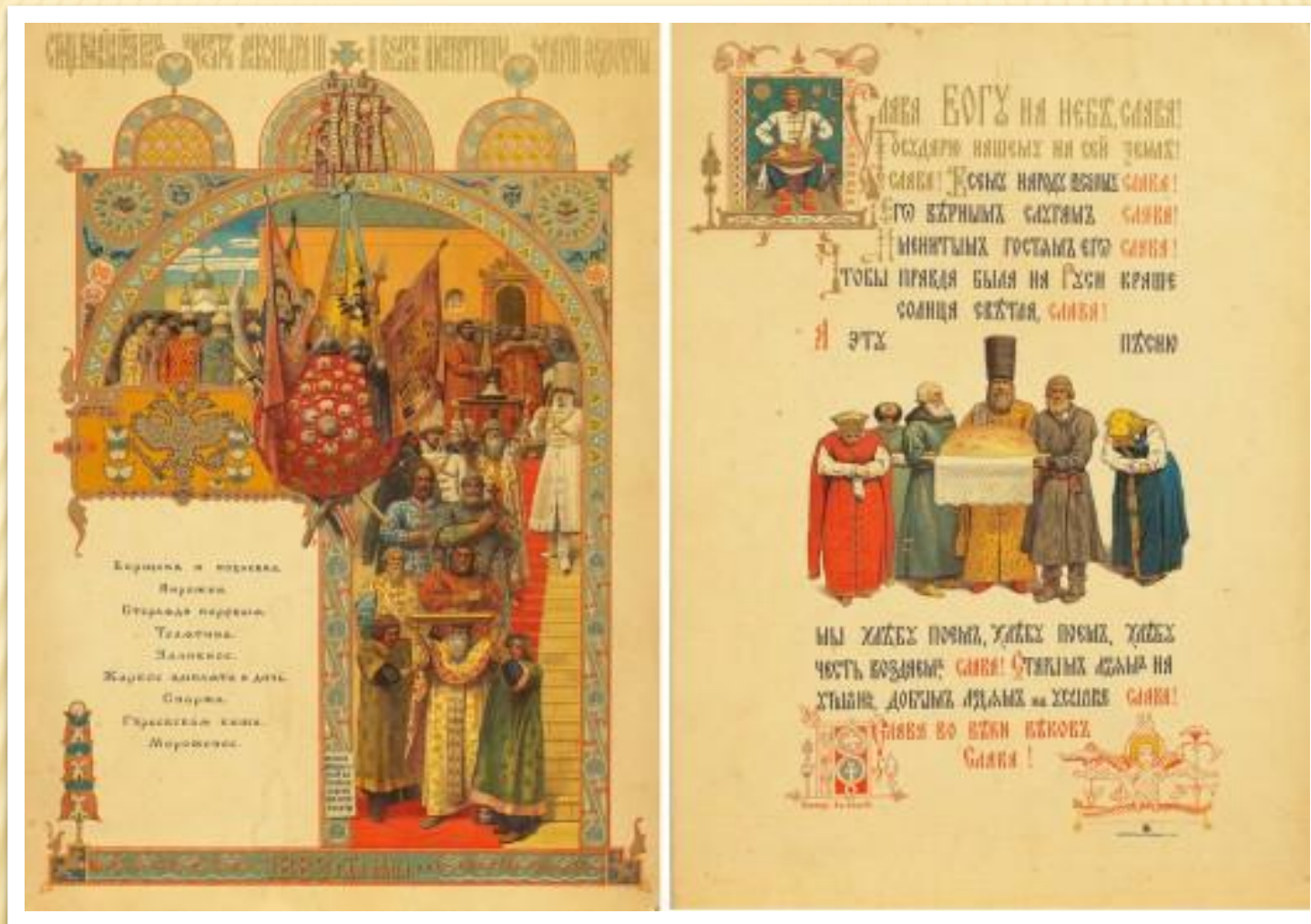
Меню в честь коронации Александра 3