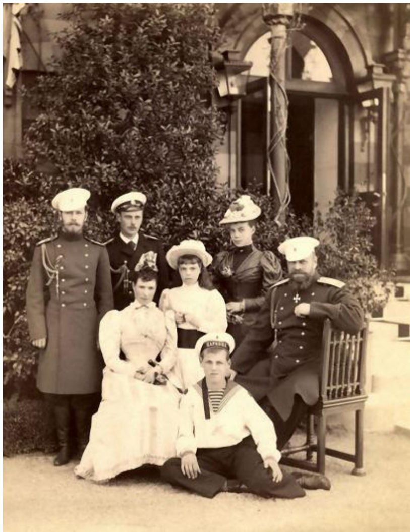
Семья Александра 3