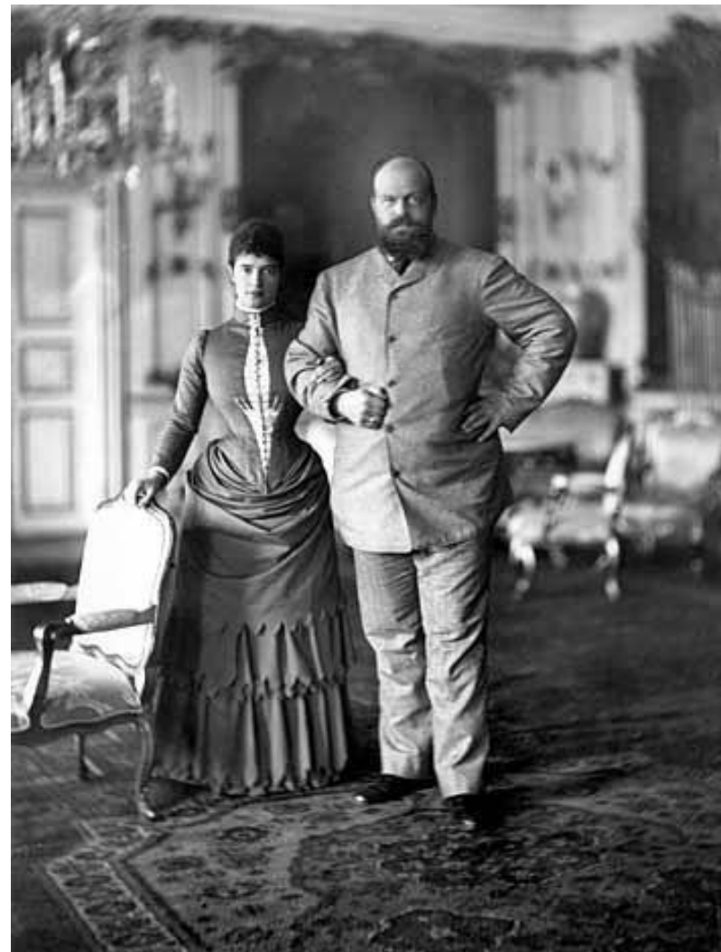
Император и императрица