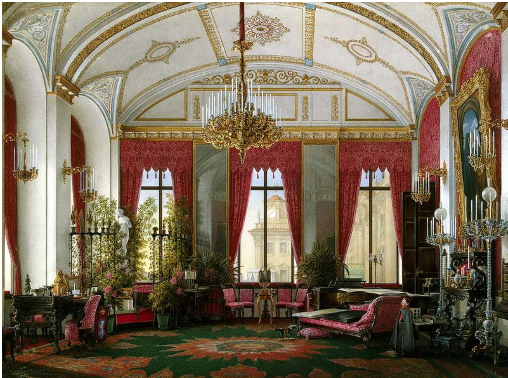
Малиновый кабинет Марии Федоровны