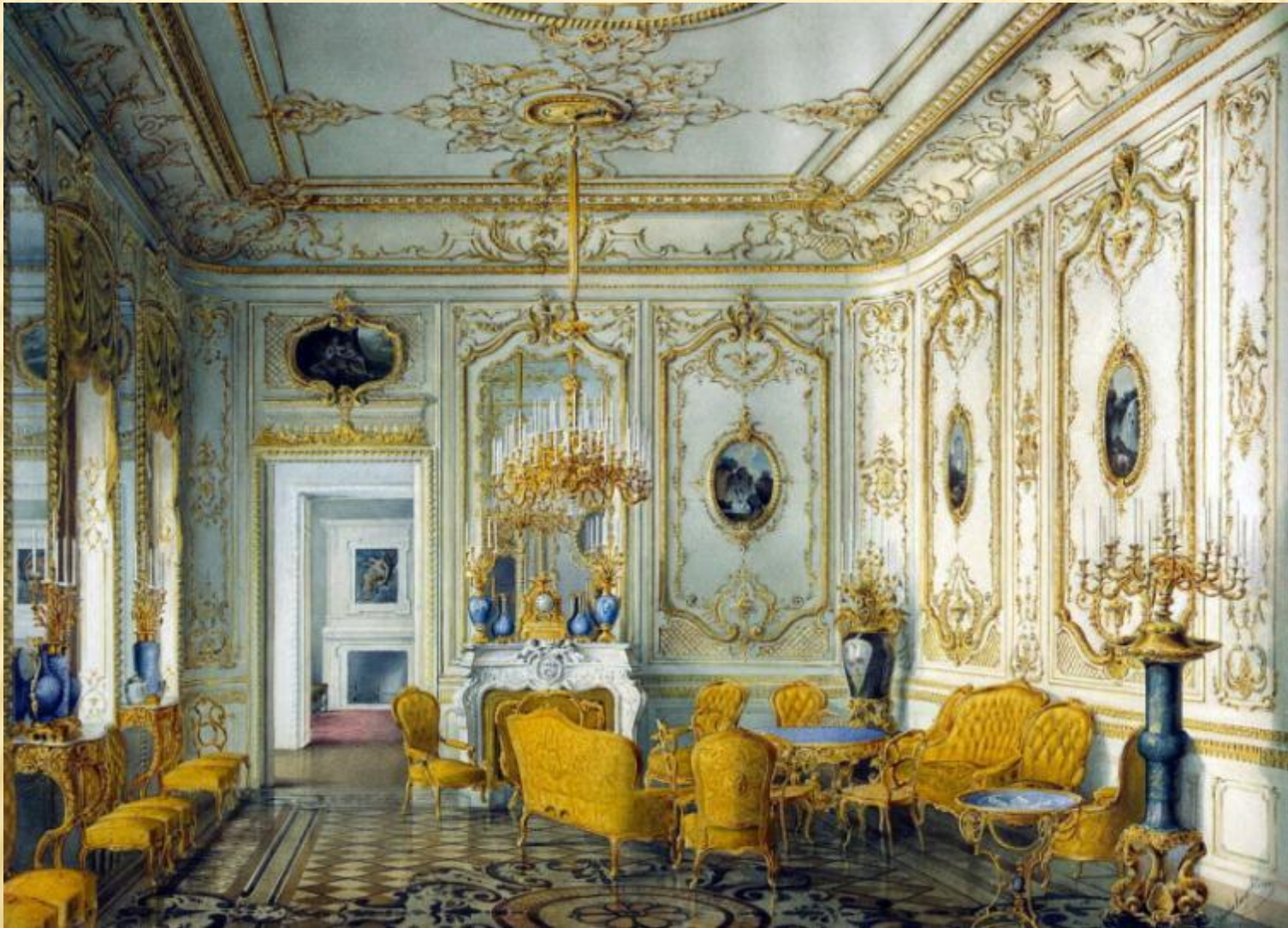
БОЛЬШАЯ СТОЛОВАЯ ЭРМИТАЖА