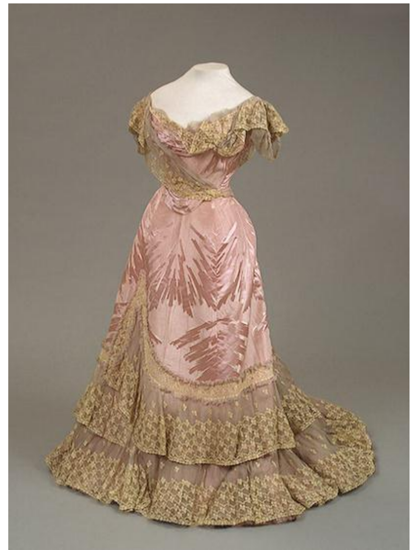
платье Марии Федоровны