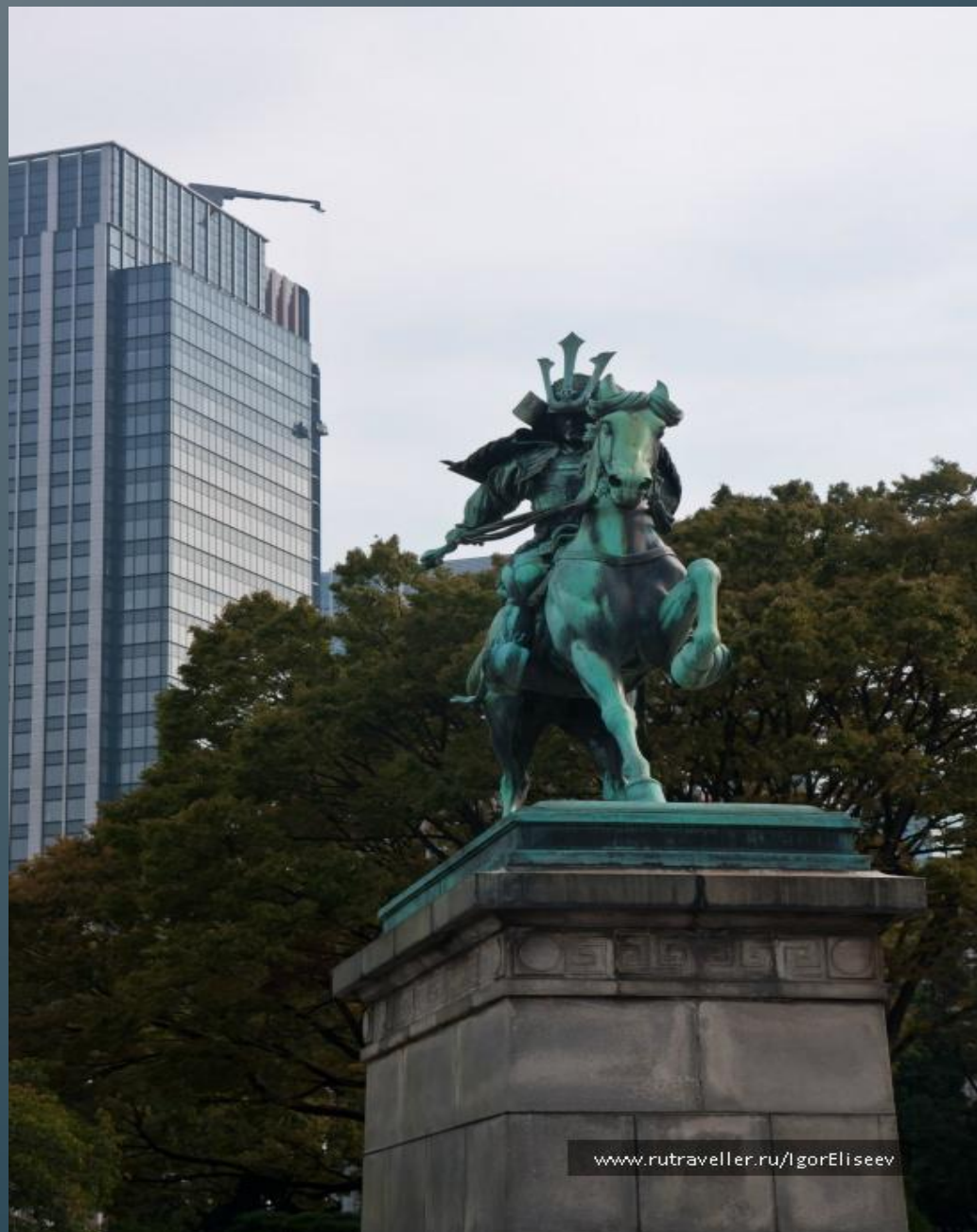
Конная статуя Кусуноки Масасигэ.