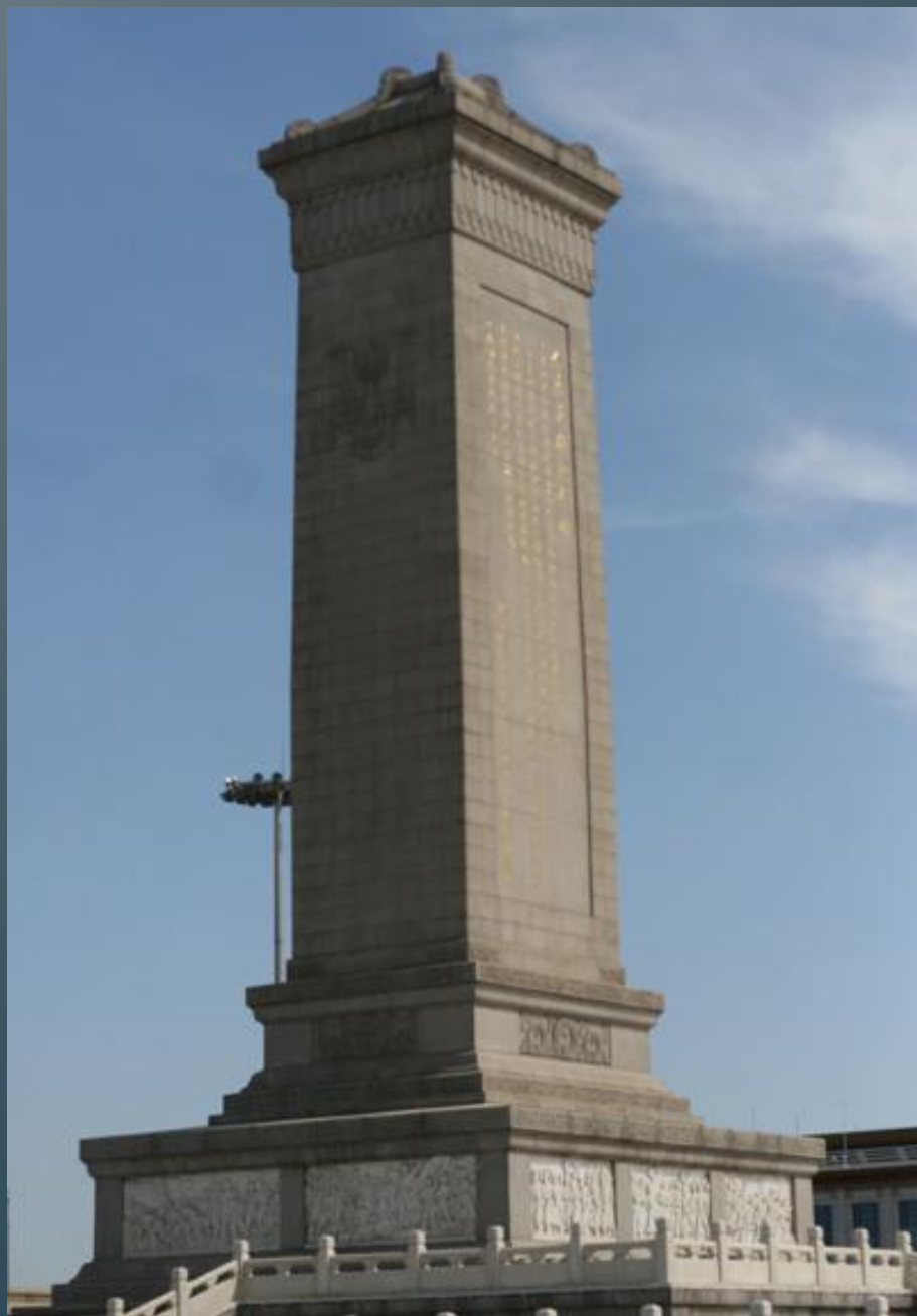
Памятник Народным Героям.