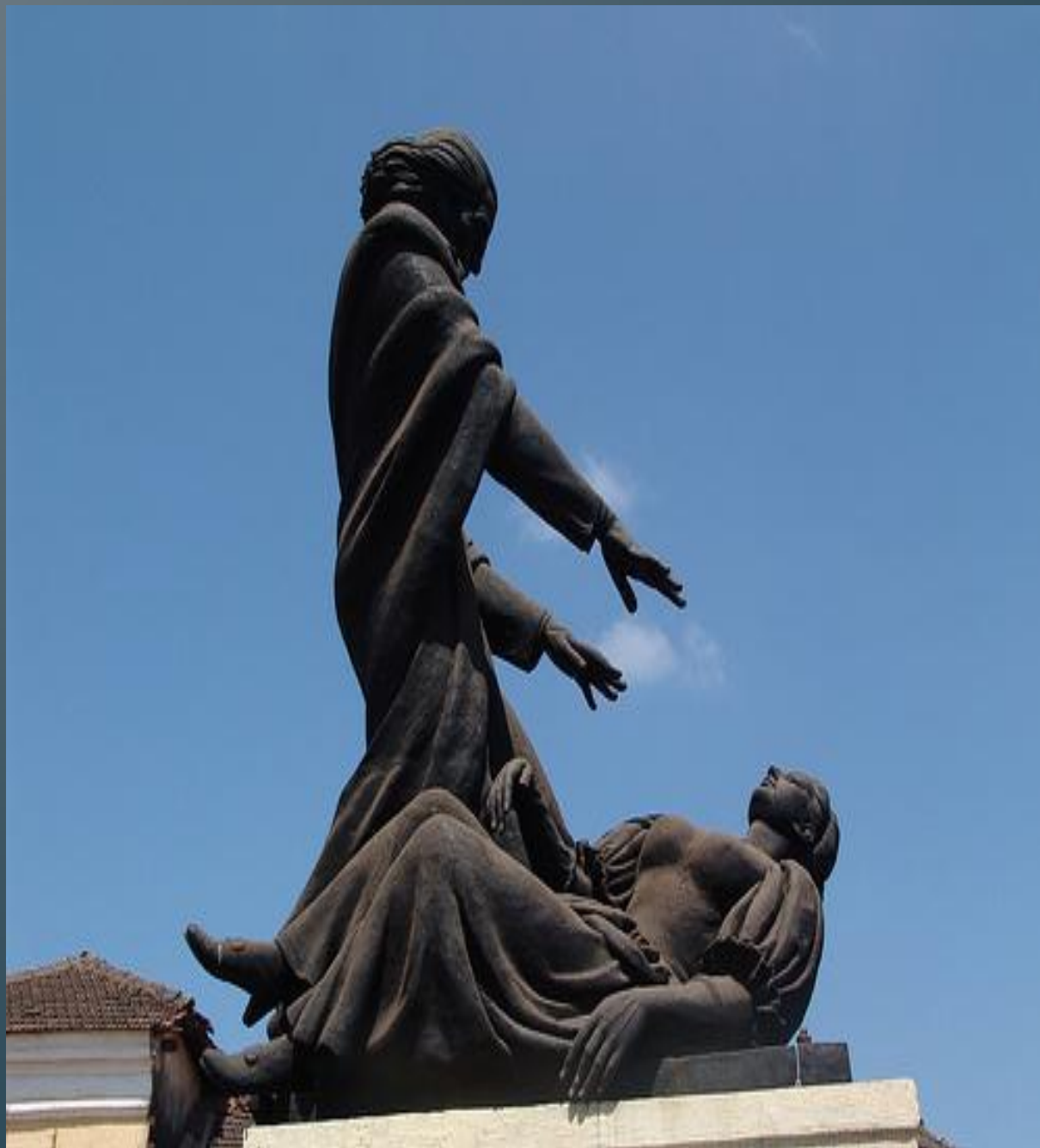
Статуя аббата Фариа.