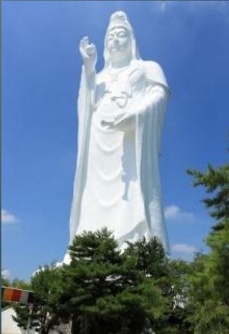
Статуя богини Каннон в Сендае.